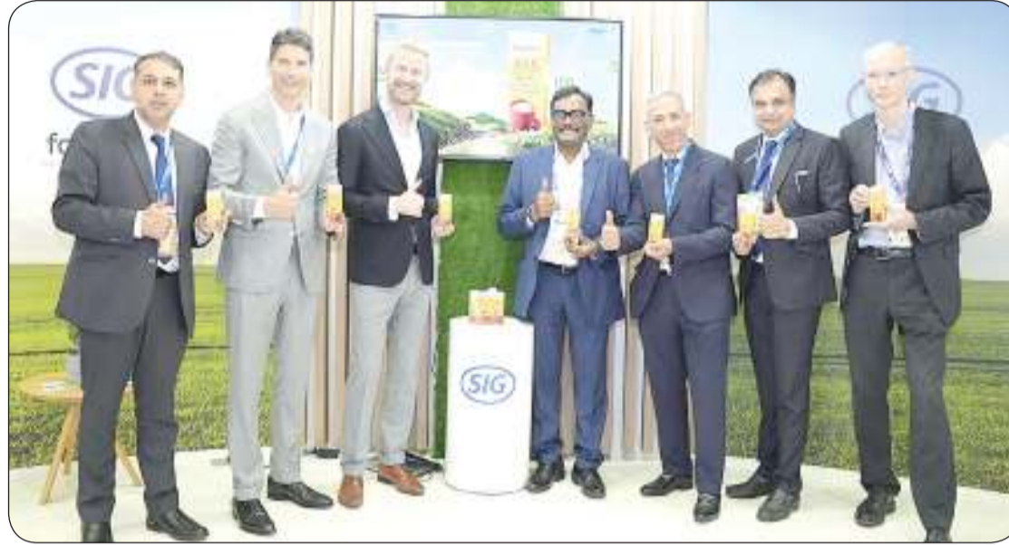
لقطة جماعية من توقيع الاتفاقية

فيتزسيمونز: خطوة ابتكارية إلى الأمام تساهم في تعزيز صحة المستهلك تاندان: ابتكار حقيقي لتحقيق تحول ملموس ضمن سوق الألبان الهندي