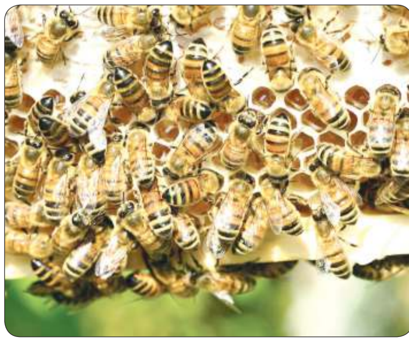
العنكب يبارب التهاب الرئة

قالت مستشارة التغذية بشركة عسل معجزة الشفاء: من أهم مزايا العنكب احتوائه على مركبات قوية حيوية كمضادة للأكسدة ولالتهابات والميكروبات، وكذلك مركبات تساعد على تجديد الخلايا والتنام الأنسجة المتضررة، لذلك قام البروفيسور آلان لوبيز مع زملائه في جامعة ريودي جانيرو بالبرازيل بدراسة التأثير الصحي لمضادات الأكسدة في العنكب على رئتي الفئران المعرضة لدخان السجائر وفعالية العنكب ضد التهاب الرئة الناتج عن تدخين السجائر. وأضافت: خلال الدراسة، تم تعريض الفئران للدخان المباشر للسجائر في غرفة مغلقة لمدة 6 دقائق وتكرر