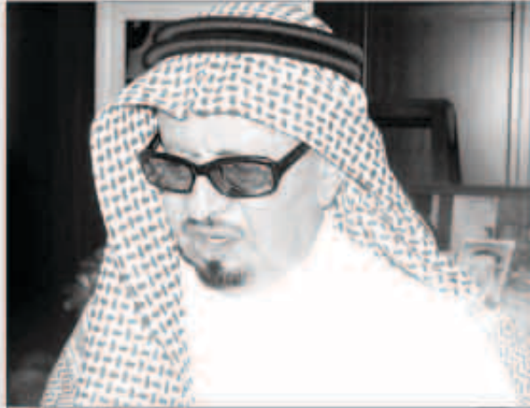
عبد العزيز الهزاع

أكد الفنان الكوميدي القدير عبدالعزيز الهزاع أن مسلسلة الإناعي الشهير «أم حديجان» سيعد في شهر رمضان المقبل بأفكار جديدة وقالب جديد «تلبية لطلب الجمهور المحب للبرنامح».