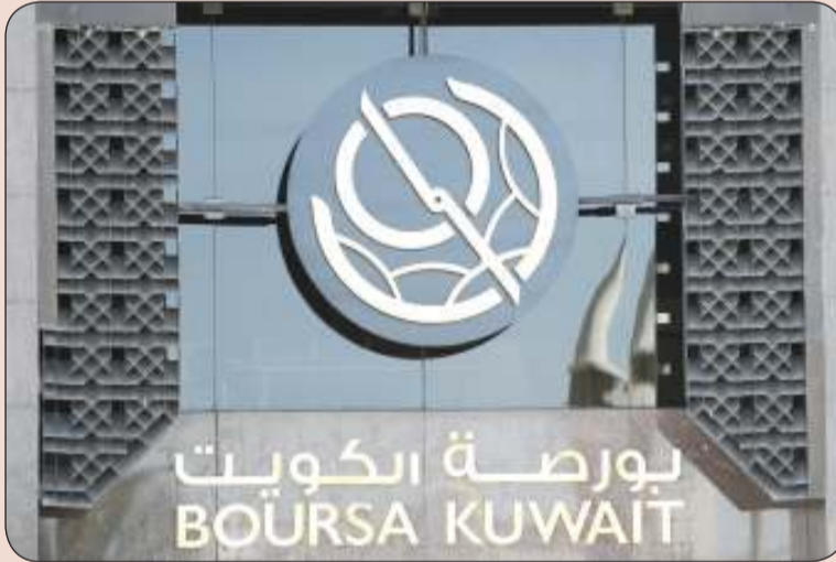
جلسة خضراء للبورصة

ارتفعت المؤشرات الرئيسية للبورصة جماعيا في ختام تعاملات أمس الأحد؛ بدعم من 10 قطاعات يتقدمها التكنولوجي. وشهدت الجلسة ارتفاع مؤشرها العام 41,7 نقطة ليلعب مستوى 5298,26 نقطة بنسبة ارتفاع بلغت 0,29 في المئة من خلال تداول 48ر6 مليون سهم عبر 1926 صفقة نقدية بقيمة 5,3 مليون دينار (نحو 16 مليون دولار). وبلغت قيمة تداولات البورصة بتعاملات أمس 32,31 مليون دينار، وزعت على 139,24 مليون سهم، بتنفيذ 7,08 ألف صفقة. دعم أداء الجلسة ارتفاع 10 قطاعات على رأسها التكنولوجي بـ 4,07 %، بينما انخفض قطاع التأمين والمواد الأساسية بـ 0,28 % و 0,23 % على التوالي، فيما استقر منافع وحيدا. وتصدر سهم "اكتتاب" القائمة الخضراء بـ 15,31 %، بينما جاء "السكك الكويتية" على رأس التراجعات بـ 6,84 %.