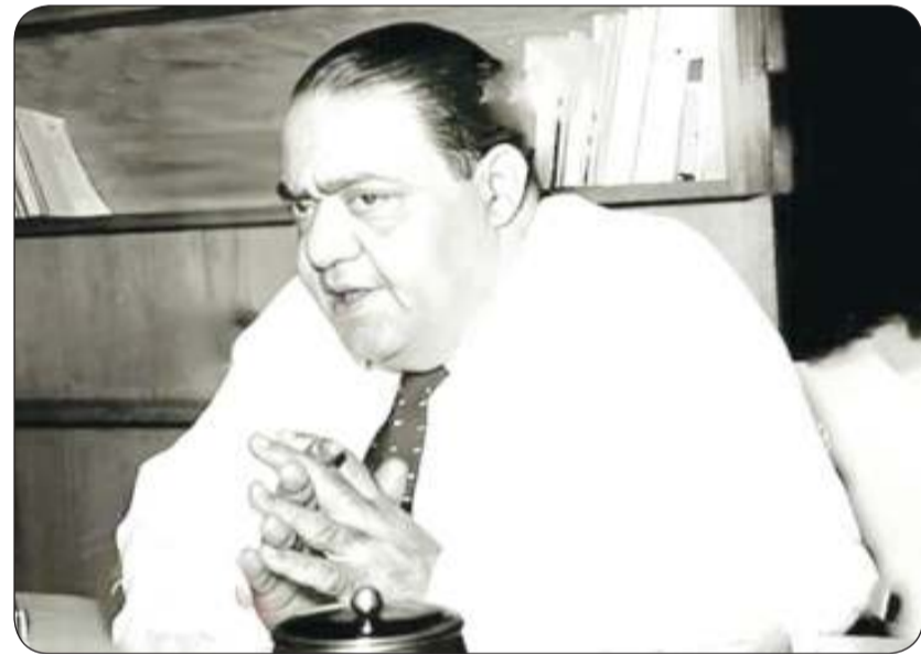
■ الشاعر كامل الشناوي

سنوات طويلة ونحن نستمتع بأغنية «لا تكذبي» الشهيرة التي كتبها الشاعر كامل الشناوي ولا نعرف أن الشناوي كتبها بدمه ودموعه وزفراته وآماته في قصة حب فاشلة من طرف واحد بعد أن وقع الشناوي في غرام المطربة نجاة الصغيرة ومنحها مجداً وشهرة ومنحته حياة بانسة لم تبادل الحب وقيل أنها كانت تعبت بمشاعره وحققت الأغنية نجاحاً كبيراً لدرجة أن ملحنها عبد الوهاب طمع فيها وغناها بنفسه ثم غناها عبد الحليم حافظ واعتبرت نجاة غناء عبد الحليم لها اعتداء عليها وعلى حقوقها ومحاولة لسرقة نجاحها وفي النهاية مات الشاعر كامل الشناوي حزينا مکتباً ليصدق عليه المثل ومن الحب ما قتل على السطور التالية نقدم الحكاية بتفاصيلها بالأمهات وأحزانها ونجاحاتها ومعاركها لتكون حاضرة في أذهاننا ونحن نستمتع إليها الشاعر كامل الشناوي الذي أمتعنا بروائع الأعمال الشعرية والقصائد الغنائية كان عاطفياً ورومانسياً يرى أن الحياة بلا حب نعيم لا يطاق فتغزل في الحب بقصائد تهز أوتار القلوب وتؤجج مشاعر