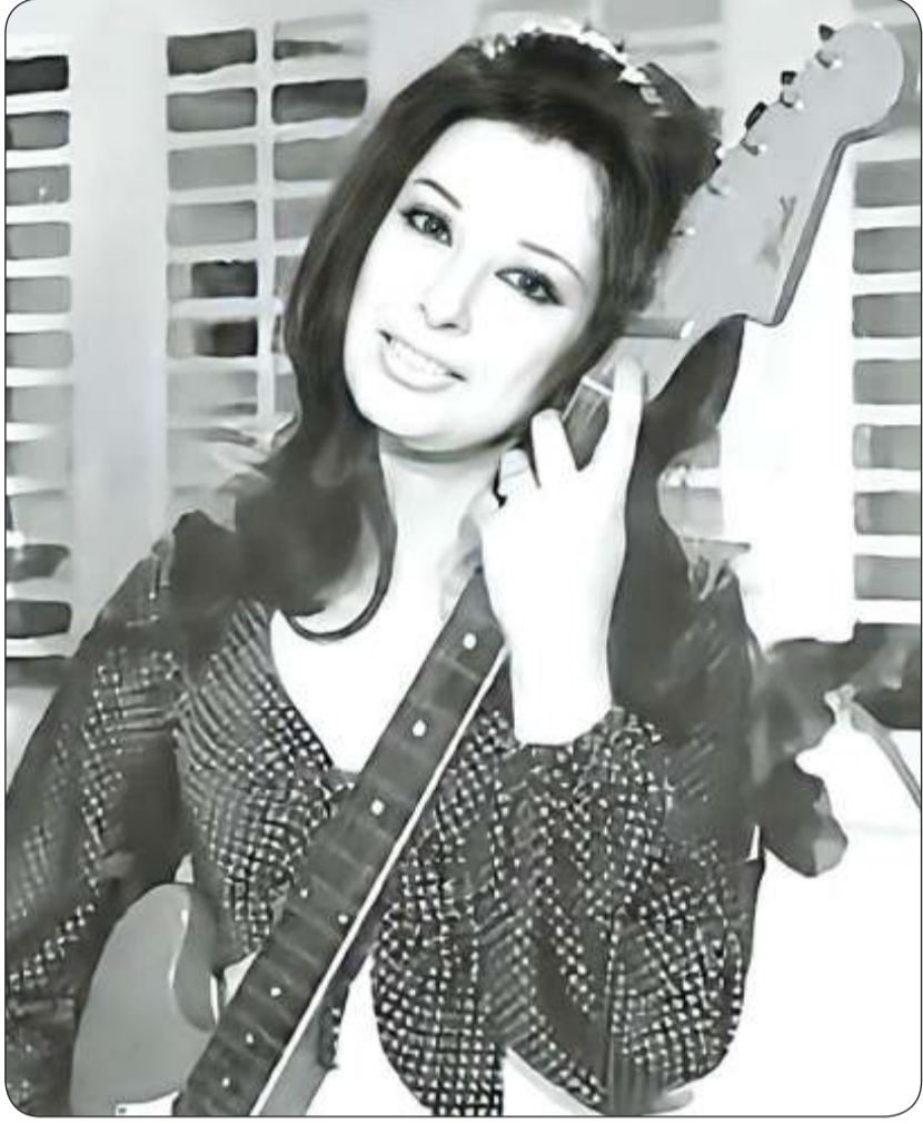
■ نجاة الصغيرة