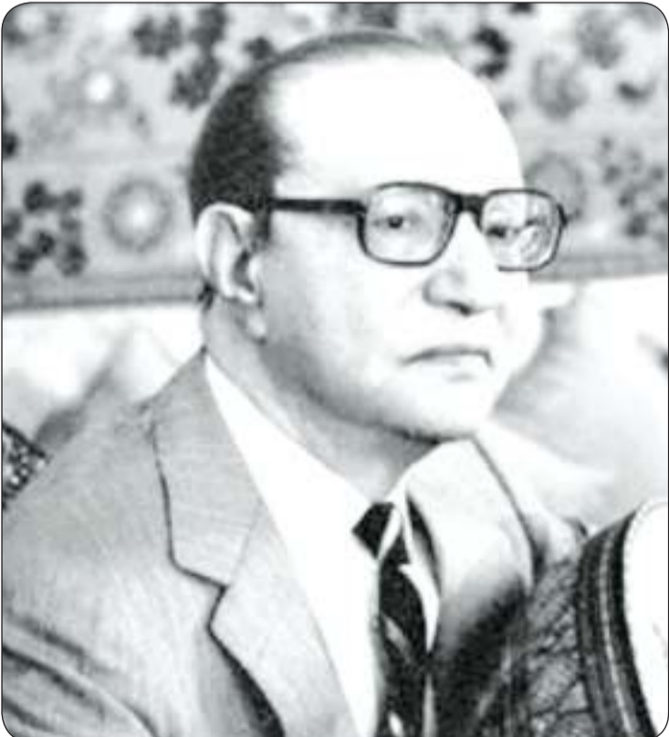
■ محمد عبد الوهاب

النفوس فغنى له كبار نجوم الطرب عبد الحليم حافظ وفريد الأطرش وأم كلثوم وعبد الوهاب ومن أغانيه «حبيبها لست وحدك حبيبها» «لست قلبي» لعبد الحليم حافظ و«غنى له فريد الأطرش عدت يا يوم مولدي» «حياتي عذاب» «الليل والحب والموت» وغنت له أم كلثوم «على باب مصر» وكان آخر أعماله الفنية أوبريت «أبو نواس» هذا الشاعر