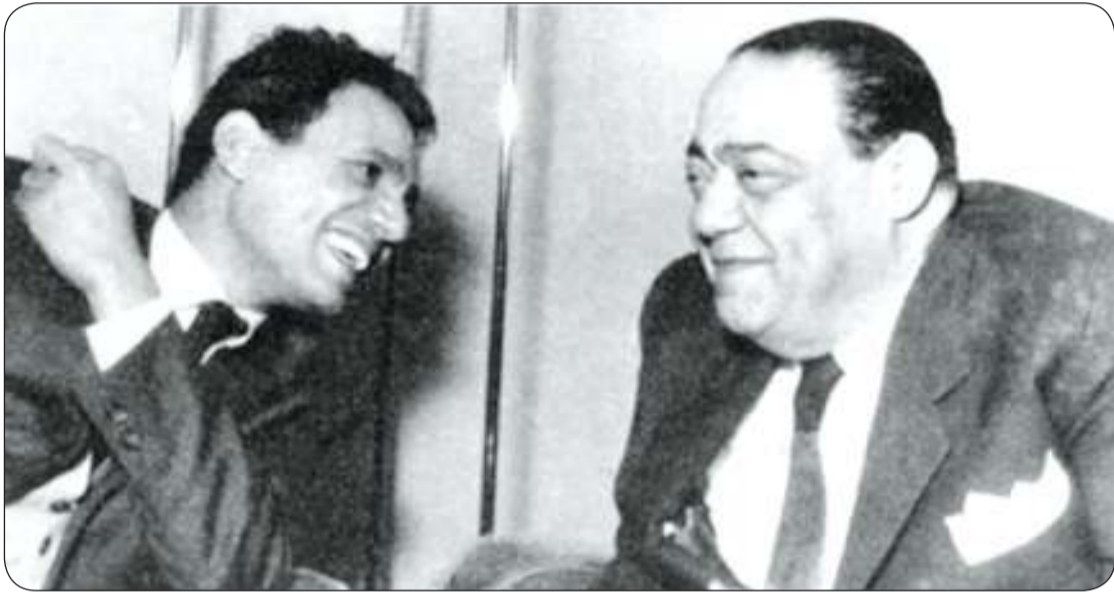
■ كامل الشناوي وعبد الحليم

مات كامل الشناوي مکتباً بعد فشل حبه لنجاة الصغيرة ●●●● غناها عبد الحليم حافظ فهاجمته نجاة في الصحف وظل الأخصام بينهم لسنوات