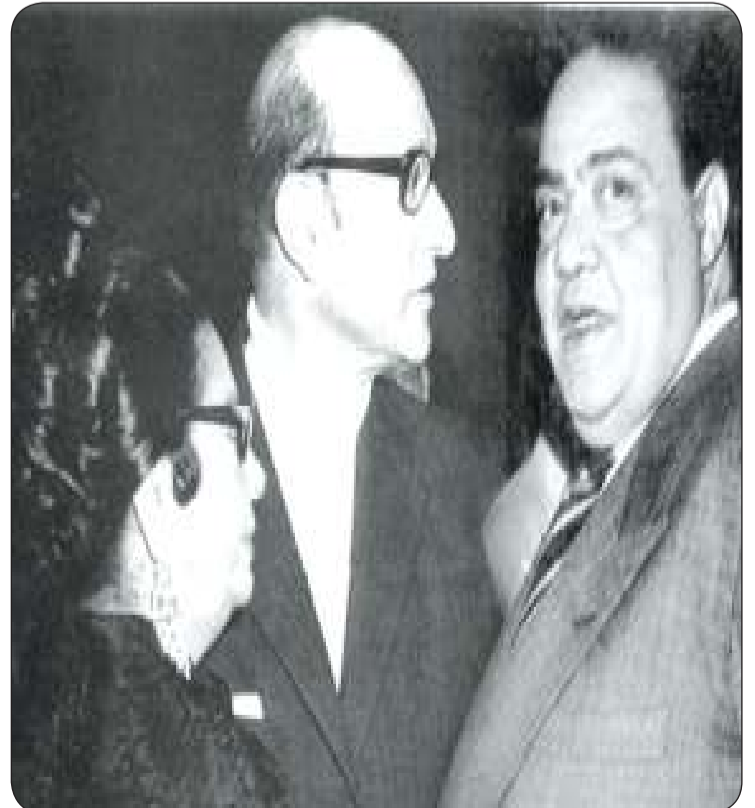
■ عبد الوهاب بين الشناوي وأم كلثوم