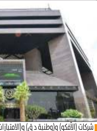
شركات (الفكو) و(وطنية دق) و(الامتيازات) والأظمة) الأكثر انخفاضا

تداول 665.3 مليون سهم عبر 22665 صفقة نقدية بقيمة 200.7 مليون دينار