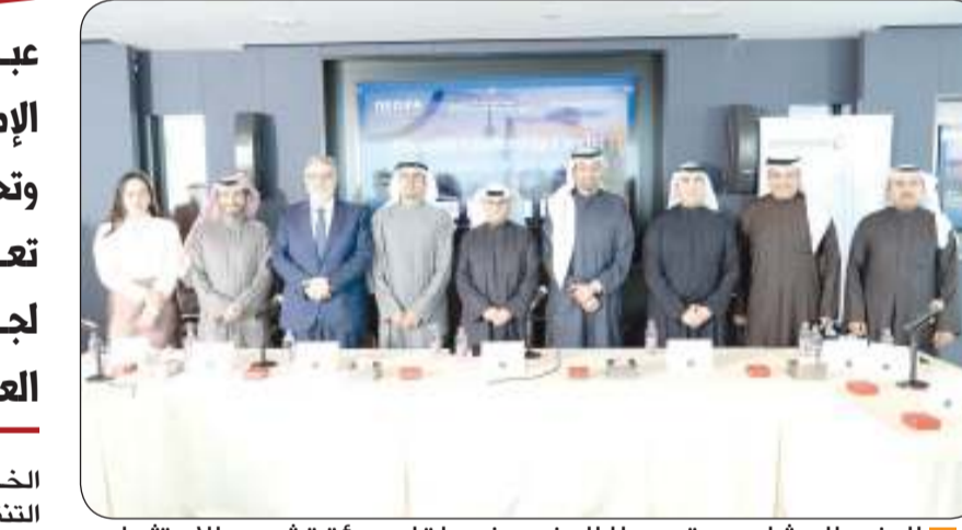
الوزير المشاري متوسلا الحضور في لقاء هيئة تشجيع الاستثمار

عبد اللطيف المشاري : انتقال الكويت نحو اقتصاد يقوده القطاع الخاص والاستثمار المستدام في الأراضي واستغلالها