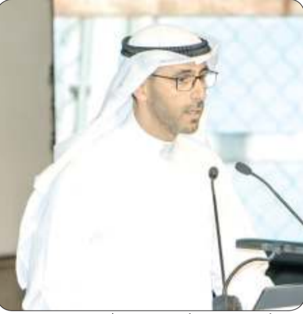
الرئيس التنفيذي لمؤسسة البترول الشيخ نواف السعوي الناصر

نواف الصباح : زراعة شجرة السدر تعكس حرص القطاع على الحد من التصحر وتحسين جودة الهواء وتقليل الانبعاثات الضارة