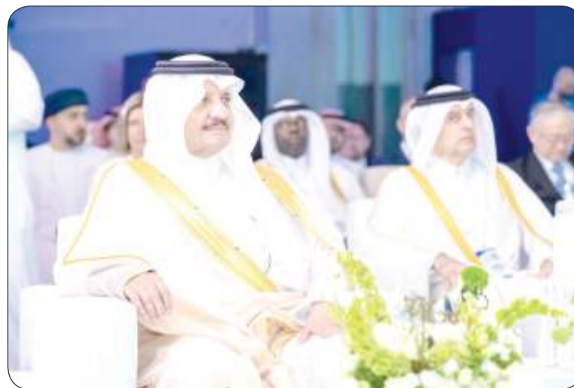
الأمير سعود بن نايف مشاركاً في المنتدى

انطلقت أعمال (المنتدى الدولي لتعزيز مستقبل الطاقة نحو الحياد الصفري) في الدمام السعودية بتنظيم هيئة الربط الكهربائي التابعة لمجلس التعاون لدول الخليج العربية ومعهد بحوث الطاقة الكهربائية الأمريكي (إبري) ويستمر يومين.