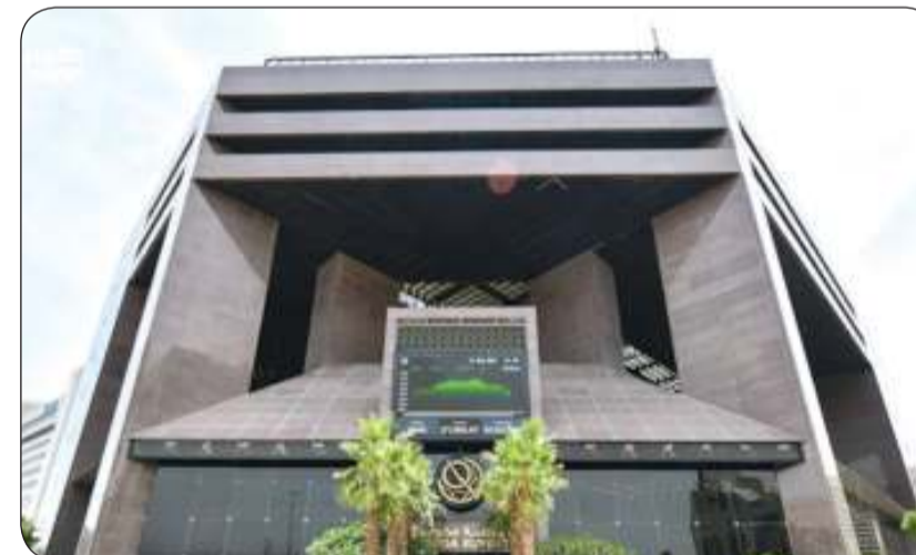
جلسة خضراء للبورصة

وعلى مستوى الأسهم، فقد ارتفع 89 سهماً على رأسها "المعدات" بواقع 26.60%، بينما تراجع 30 سهماً على رأسها "مدينة الأعمال" بنحو 9.09%، فيما استقر سعر 10 أسهم. وجاء سهم "مدينة الأعمال"، في مقدمة نشاط الكميات بحجم بلغ 42.83 مليون سهم، وتصدرت السبولة سهم "بيتك" بقيمة 11.68 مليون دينار.