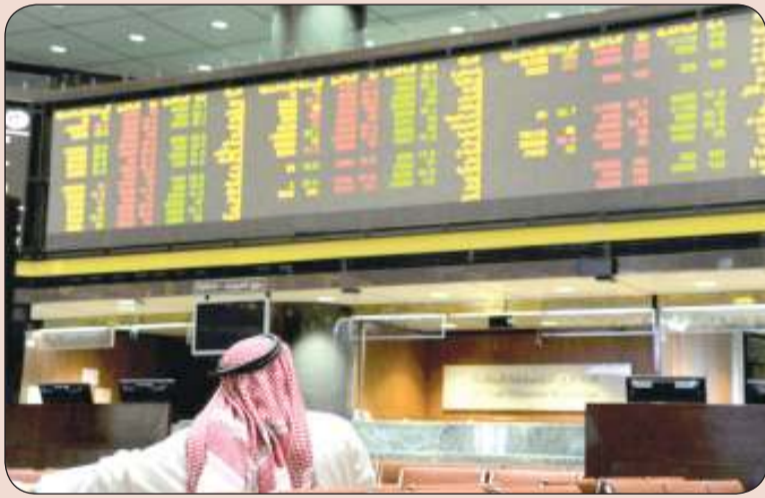
■ جلسة متباينة للبورصة

كما هو للاستثمار إن المؤشر العام لبورصة الكويت عوض بعض من خسائره التي مني بها في أول جلستين من هذا الأسبوع على إثر تفاقم المخاوف من أن تتوسع دائرة الصراع في الشرق الأوسط.