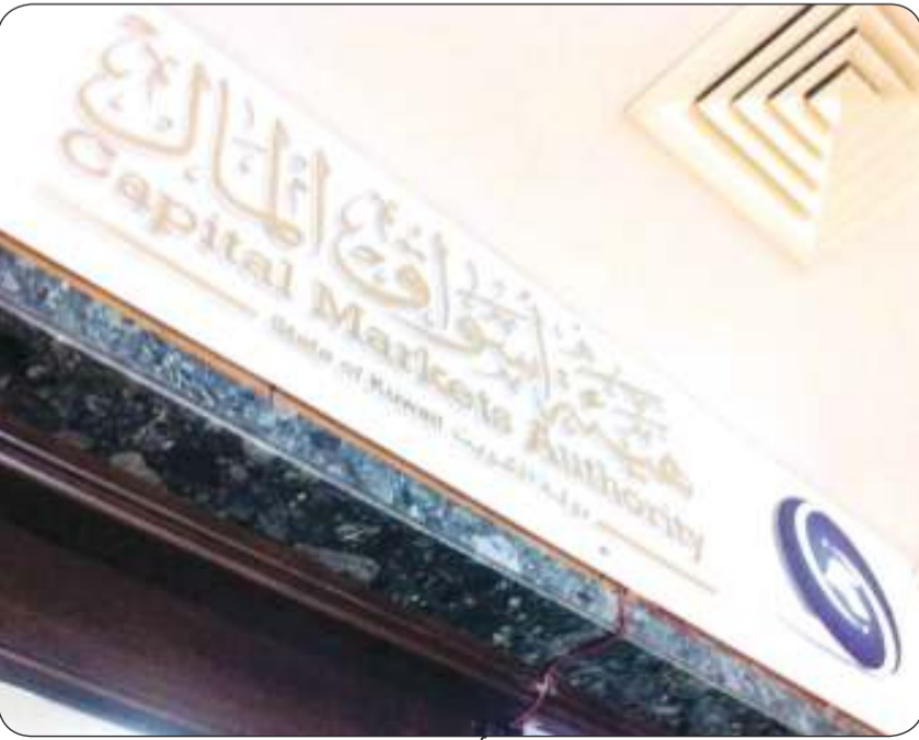
■ هيئة أسواق المال

أعلنت شركة الكويت والشرق الأوسط لاستثمار المال "كميفك" صدور قرار مجلس التأديب بهيئة أسواق المال في جلسته المنعقدة يوم الإثنين الموافق 9 أكتوبر 2023، في المخالفة رقم (18/2023) مجلس تأديب (184/2022 هيئة). وأوضحت الشركة في بيان للبورصة الكويت أمس الثلاثاء، أنه تم توقيع جزاء التنبيه في المخالفة الأولى لاستمرار الشركة في عدم الالتزام بحكم البند رقم (2) من المادة (193) من الكتاب السادس عشر من اللائحة التنفيذية للقانون رقم (7) لسنة