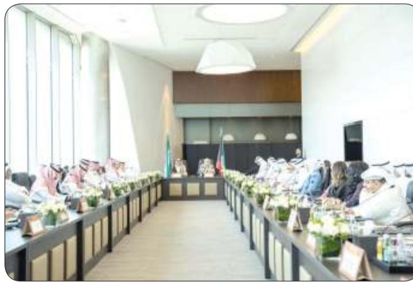
■ جانب من الاجتماع

وقد أكد رئيسها الجانبين على أهمية بناء مستهدفات طموحة بين البلدين لتنمية الشراكة في كافة مجالات التعاون، وأهمية العمل على تحقيق تطورات القيادة الرشيدة ضمن نطاق عمل اللجنة، كما أكد على رغبتها في