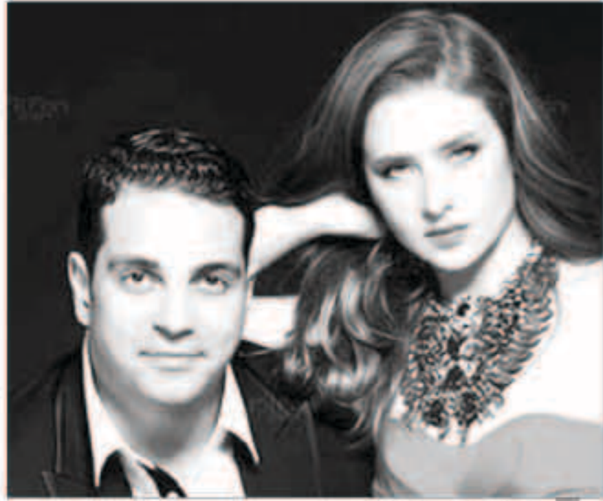
نيللي كريم مع طليقها هاني أبو النجا