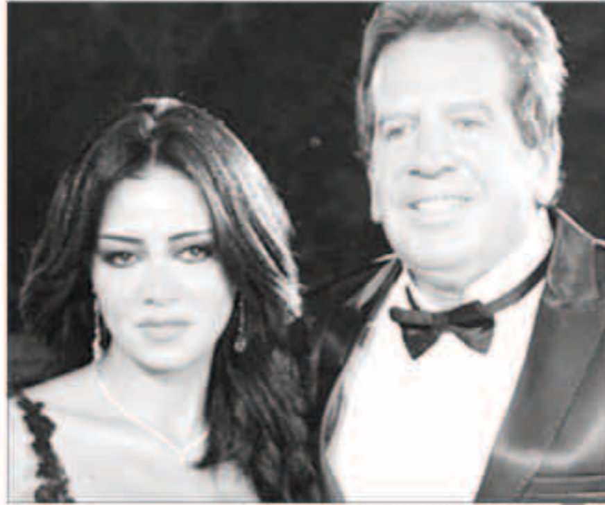
رانيا يوسف مع طليقها محمد مختار