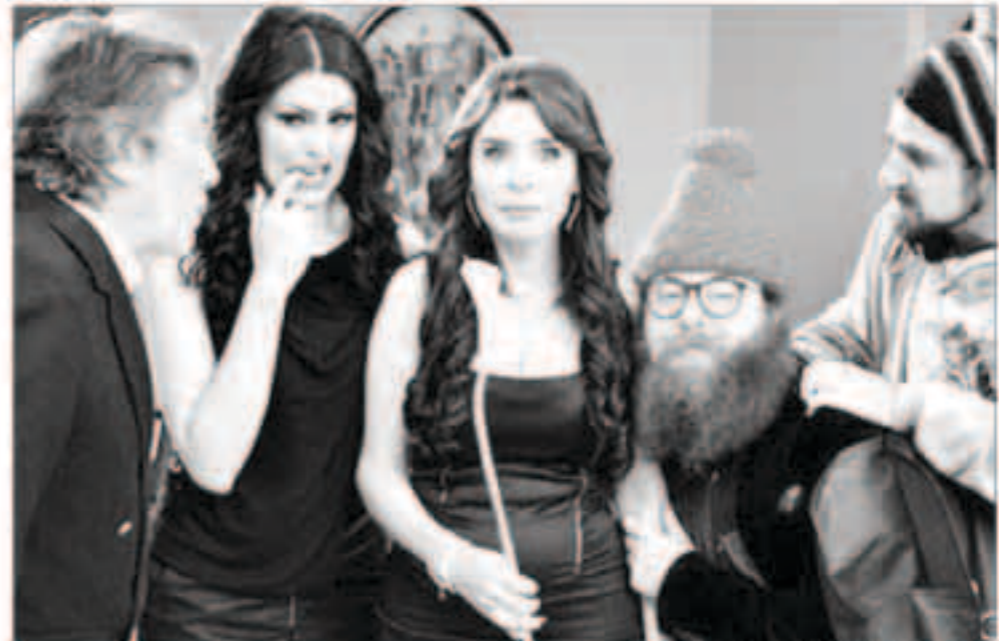
لقطة من فيلم سعيكم مشكور.