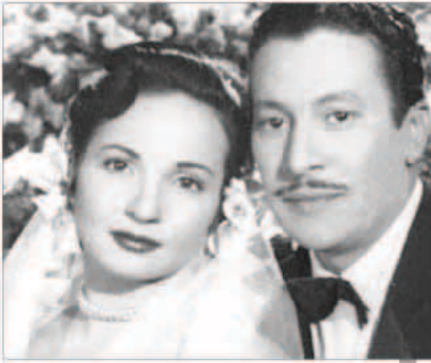
عماد حمدي وشادية

تزوج الفنان عماد حمدي من الفنانة شادية، رغم أنه أكبر منها بـ 20 عامًا، لكن هذا الزواج لم يستمر طويلا بسبب غيرة «حمدي» الشديدة، حيث وقعت بينهما العديد من الخلافات، كانت آخرها صفعه لها أمام أصدقائها في إحدى الحفلات، وهنا قررت شادية الانفصال رغم محاولات حمدي في الرجوع إليها. تزوجت شادية مرة أخرى من مهندس بالإذاعة المصرية، لكن طلقت منه، لتقابل بعد ذلك صلاح ذو الفقار وتشاركه في أكثر من عمل فني، حتى اشتعلت