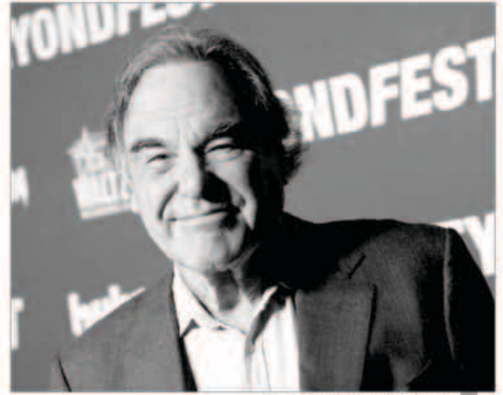
المخرج الأمريكي أوليفر ستون رئيس لجنة التحكيم

بصحبة 14 شريكاً من المؤسسات والمهرجانات الدولية