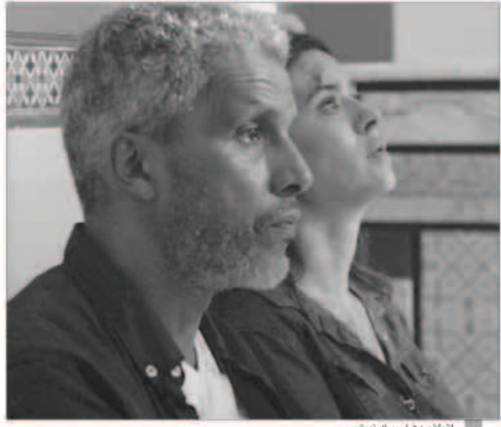
لقطة من فيلم «بيك نعيش»

إنسانية تدور أحداثها وراء أبواب مغلقة.. وقد نال جائزة أفضل ممثل عن دوره في الفيلم في مهرجان المندفلة السينمائي الدولي العام الماضي. تتابع كاميرا البرصاوي، على امتداد ساعة ونصف الساعة، الزوجين في سياق مع الزمن بحثاً عن متبرع لإنقاذ الابن، وتكشف حدود المؤسسة الاستشفائية في إيجاد حل قوري أمام «قائمة الانتظار الطويلة جداً» على حد قول الطبيب في الفيلم. كذلك، يُبرز ظاهرة الفساد التي تتخرب القطاع الطبي من خلال مشهد تسريب ملف المريض إلى من يمتحن الإبحار بالأعضاء البشرية، وكذلك الأمن الذي يتلقى رشى لتسهيل عملية نقلهم. وتخلل الفيلم مقاطع صادمة وعينيفة تبرز الانتهاكات التي تطال الأطفال، تصل إلى حد استئصال بعض الأعضاء من أجسامهم ليبيعا خلسة وبمبالغ كبيرة. ويؤكد البرصاوي أن فكرة العجل «مستوحاة من مقطع فيديو صادم حول الانحمار بأعضاء في ليبيا».