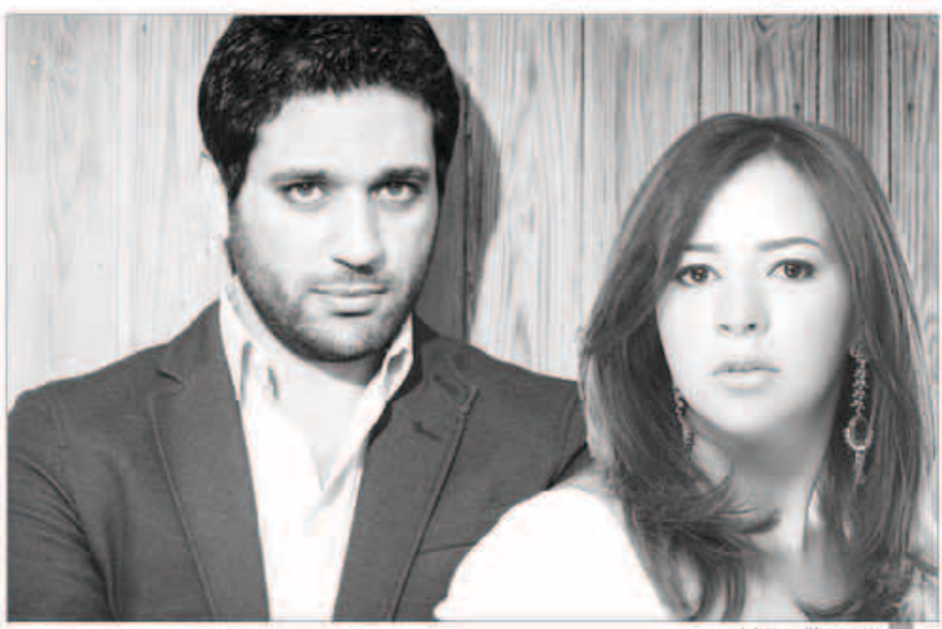
إيمي سمير غانم وحسن الرواد

تعود الفنانة إيمي سمير غانم للدراما التلفزيونية من خلال مسلسلها الجديد «عزمي وأشجان» والذي تقوم ببطولته مع زوجها حسن الرواد، ومن المقرر عرضه في رمضان 2018 و تدور أحداثه حول العلاقة بين زوجين في إطار كوميدي يكرر من خلاله الممثل أحمد السبكي تجربة الإنتاج التلفزيوني. إسم بطلي للمسلسل «عزمي وأشجان» مسطوح من أسماء الشخصيات التي قدمتها فيفي عبده وكمال أبو ربة في مسلسل «طائر الحب» الذي رغم أنه عرض عام 2005 لكنه عاد للتداول مؤخراً على مواقع التواصل الاجتماعي بعد أن قامت إحدى المحطات بإعادة عرضه، وكان مقار سخرية عدد لا بأس به من المتابعين بسبب المشاهد الرومانسية التي تجمع بين عبده وأبو ربة والتي رغم جديتها... تم عمل «كوميكس» ساخرة منها. المسلسل الجديد مرشح للاشتراك فيه الفنان سمير غانم، فيما سيتم بناء الدور الرئيسي في حارة السبكي بالحزام الأخضر لتصوير الجزء الرئيسي من الأحداث هناك تحت إدارة للمخرج خالد الحلواني الذي بدأ معاينة أماكن التصوير.