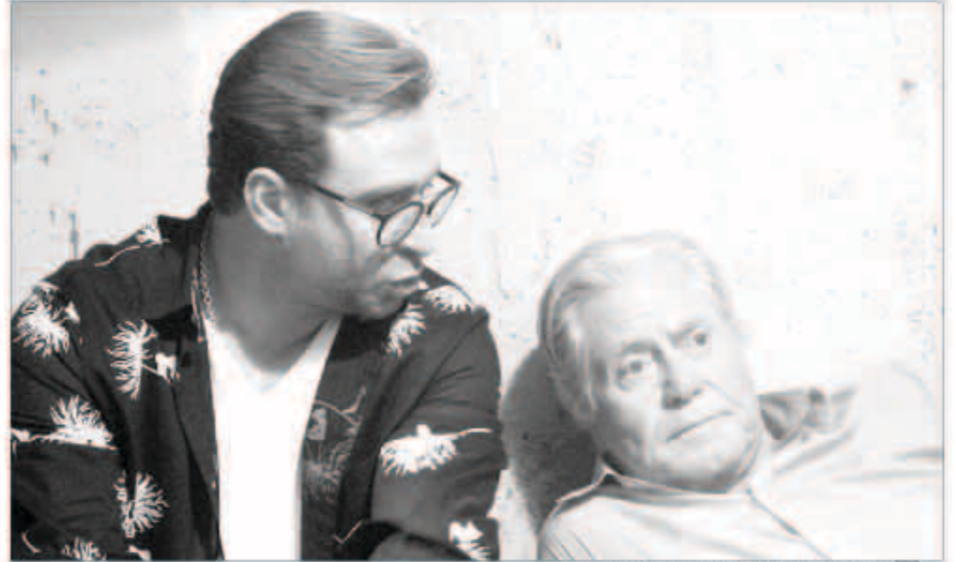
حسين فهمي وإيصال الشافعي في مشهد من مسلسل «النس»

المصرية الخاصة يوم السبت المقبل حيث تعبر قصته عن الواقع المصري الحالي، وتجري أحداث المسلسل في إطار درامي حول الأخلاق والقيم والمبادئ التي أصبحت تسود المجتمع في هذا العصر، والرغبة التي تجتاح الجميع في التراء ولو على حساب الأخلاق. وأكد السيناريست محمد رجب أن المسلسل يعبر بصديق عن الواقع الحالي، ويعتبر المسلسل واحداً من المسلسلات الاجتماعية العائلية الكلاسيكية ذات الطابع المصري الواقعي، وأعرب محمد رجب عن سخطه على موقع التواصل الاجتماعي «فيسبوك» عن أمه في أن يعيد المسلسل إلى الأذهان مسلسلات اجتماعية حققت رواجاً في التسعينيات من القرن الماضي، ويشترك في بطولة «الطوفان» ماجد المصري، وأحمد زاهر، وروجينا، وأمين عاصم، ومحمد عادل، وإيهاب فهمي، وفنشي عبدالوهاب، ووفاء عاصم، وعائدة رياض، وريهام عبد الغفور، وأحمد بيدر، ورامي وحيد، ونجلاء بدر، وسيد رجب، وغير صبري، وعد كبير من النجوم. تأليف بشير الديك، وسيناريو وحوار محمد رجب، وإخراج خيرى بشارة.