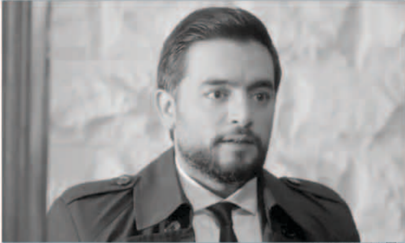
هاني سلامة في مسلسل نصيب وقسمتك