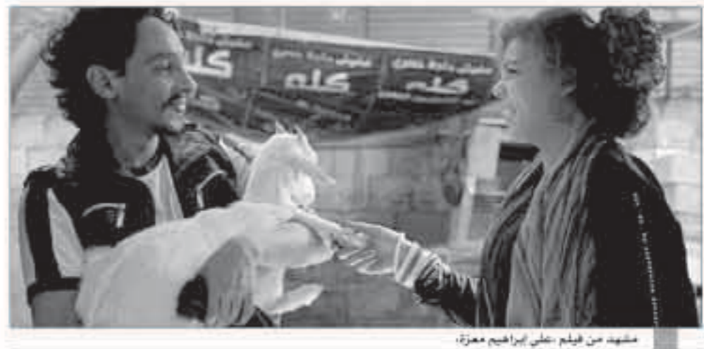
مشهد من فيلم «على إبراهيم معزة»

وقع اختيار إدارة مهرجان الفيلم العربي بمدينة روتردام الهولندية على الفيلم المصري «على إبراهيم معزة»، ليفتح فعاليات الدورة المقبلة للمهرجان، والتي ستقام في الفترة من 11 إلى 15 أكتوبر المقبل. وأعلن القائمون على المهرجان خلال المؤتمر الصحفي الذي عقد مؤخراً بمدينة روتردام، أن المهرجان سيرفض خلال دورته المقبلة 22 فيلماً عربياً، يتنافس 5 منها على جائزة أفضل فيلم طويل، كما يقدم المهرجان جائزة «الجميل الذهبي» لأفضل فيلم قصير.