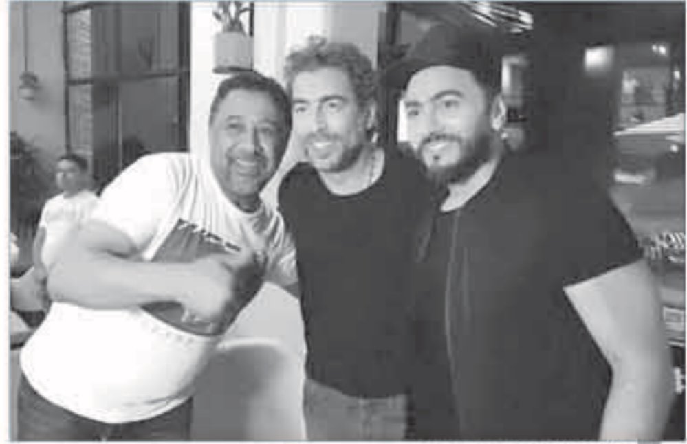
الشباب خالد وتامر حسني وسعيد الماروق

تحت إدارة المخرج سعيد الماروق، يشارك الفنان تامر حسني والشباب خالد والتجسس دويبو بالتهجتي المصرية والجزائرية، لم يتم الكشف عن اسمها حتى الآن. ولقد نشر المخرج سعيد الماروق صورة من كواليس العمل بتصوير خالد الشباب حسني، وعلق عليها: «الأسطورتان.. قريباً..» هذه الأغنية التي تم تسجيلها منذ عدة أشهر بقول مطلعها: «من القاهرة إلى وهران» وهي أغنية وطنية، عرض تامر حسني على الشباب خالد أن يغنيها معه فوافق على الفور بعد رفضه للعديد من الدويتوهات بسبب عدم إعجابها بها.