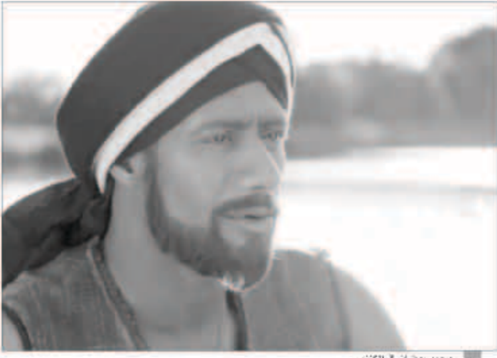
محمد رمضان في «الكنز»

حسني، ومن تأليف صلاح الجهيني، وإخراج طارق العريان، وبعد احتلال فيلمه «الكنز» المركز الثاني في الإيرادات بمبلغ تجاوز 13 مليون جنيه، توعد محمد رمضان منافسيه بأنه سيكون الأول مجدداً في العام المقبل. وعزا رمضان احتلاله المركز الثاني إلى محاولته تغيير من