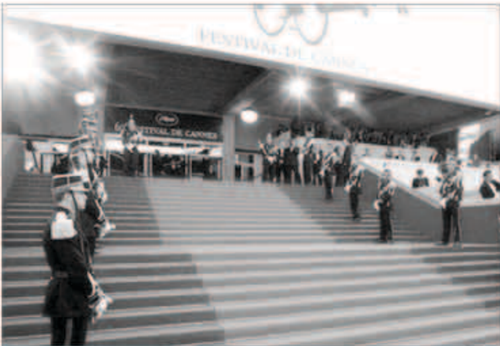
جانب من استعدادات مهرجان كان السينمائي بدورته السبعين

على القائمين عن أي فيلم مشارك في المنافسة ان يتبعوا بتوزيعه على الصالات الفرنسية. وقال استاذ اقتصاد السينما في جامعة السوربون لوران كريتون إن مهرجان كان «بات على موعد دائم مع المواضيع الإشكالية. لكن هذه المرة، نحن في صدد موضوع جدلي كبير يتعلق بالهوية نفسها للسينما. في هذه المباراة، لا يريد أحد التنازل. بالنسبة للممثلين، من غير الوارد منح جائزة السعفة الذهبية لفيلم لن يعرض في الصالات. لقد حفظوا ماء الوجه». ومن شأن هذا الجدل إعادة تفعيل النقاشات في شأن تشريع فرنسي يفرض هيئة ثلاث سنوات بين عرض عمل ما في الصالات وبله عبر منصة الكترونية للمشاركين، وجرت محادثات خيرا بين الخصامين في القطاع بهدف تقصير هذه المهلة غير أنها باتت بالقتل. والسى الأفلام التسعة عشر المشاركة في المنافسة، يمكن ترواح مهرجان كان هذه السنة اكتشاف الموسم الثاني من «توب أوف ذي لايد» لجان كميون وحلقين من الموسم الثالث من المسلسل الشهير «توين بيكس» لديفيد لينش. هذان المسلسلان هما في الواجهة الرسمية للأعمال خارج المنافسة، ما يمثل تنويعا لمنطق فني بات يعتمد في إنجازة أساليب السينما مع مقلبيها ومخرجيها.