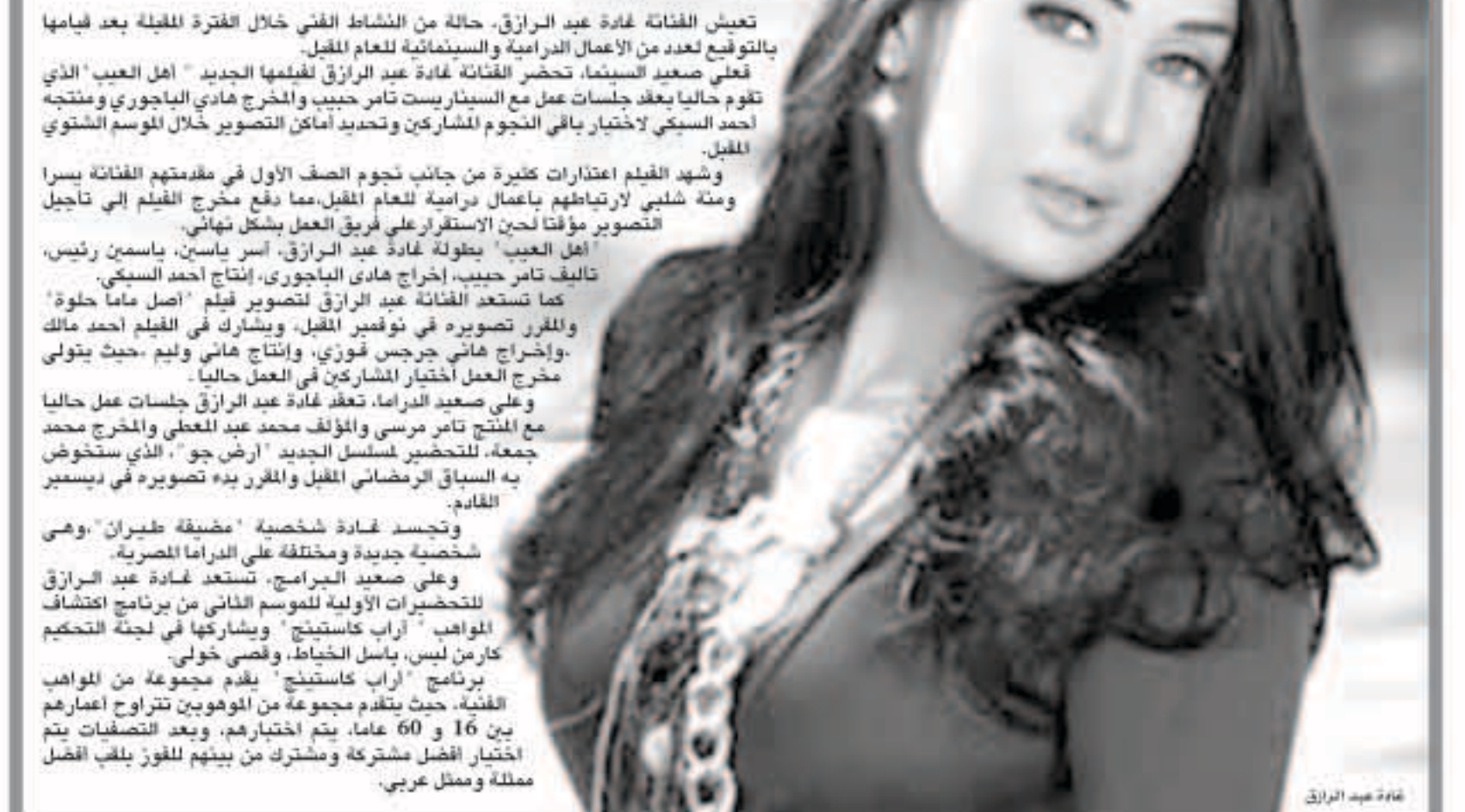
غادة عبد الرازق