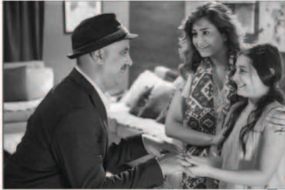
من كواليس فيلم تحت الترابيزة