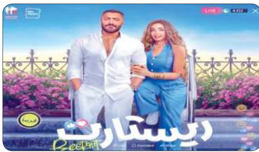
■ بوستر ريستارت