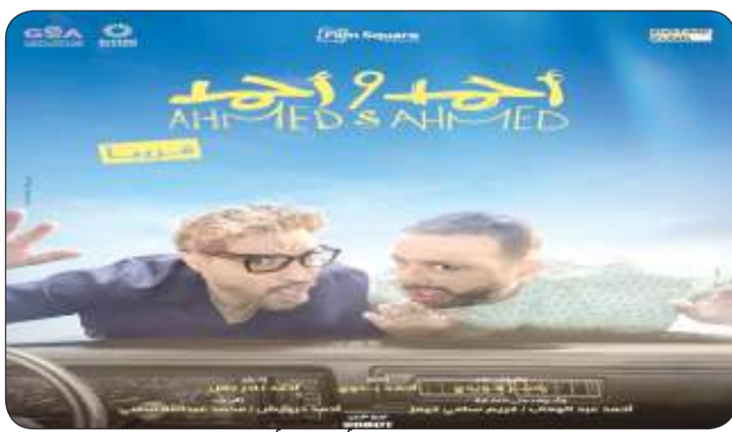
■ بوستر فيلم أحمد وأحمد

وتدور أحداث فيلم «أحمد وأحمد» في إطار لايت لا يخلو من التشويق، إذ يجسد أحمد فهمي دور مهندس ديكور بينما يجسد أحمد السقا دور خاله الذي يشبهه كثيرا، وتنعض لهما جيهان الشماشجي التي تلعب دور حبيبة أحمد فهمي، وفجأة يقع الثلاثي في ورطة ويصبحون مطاردين من عصابة، وخلال رحلتهم في الهروب من هذه العصابة يتعرضون للعديد من المواقف والمفارقات الكوميديا.