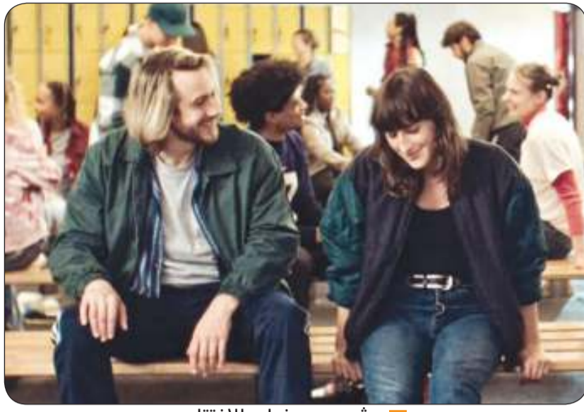
■ مشهد من فيلم الافتتاح

وقال النجم العالم روبرت دي نيرو: «لدي مشاعر قوية للغاية تجاه مهرجان كان السينمائي. وخاصة اليوم، عندما يفصلنا الكثير في العالم، يجتمعنا مهرجان كان: رواية القصص، وصناعة الأفلام، والمعجبون، والأصدقاء. كأننا نعود إلى المنزل».