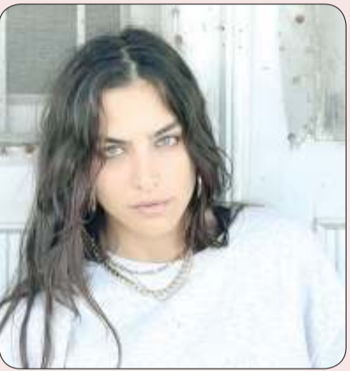
■ ريم خوري

جمعت ثلاثة أعمال درامية بين ريم خوري وباسل خياط، حيث بدأ التعاون بينهما في مسلسل «الكاتب»، ثم «التمن»، ويعودان اليوم في مسلسل «أسر» في أقرب أدوار ريم إلى خط شخصية باسل الرئيسي. خط درامي مميز يجمع ريم خوري وباسل خياط في مسلسل «أسر».