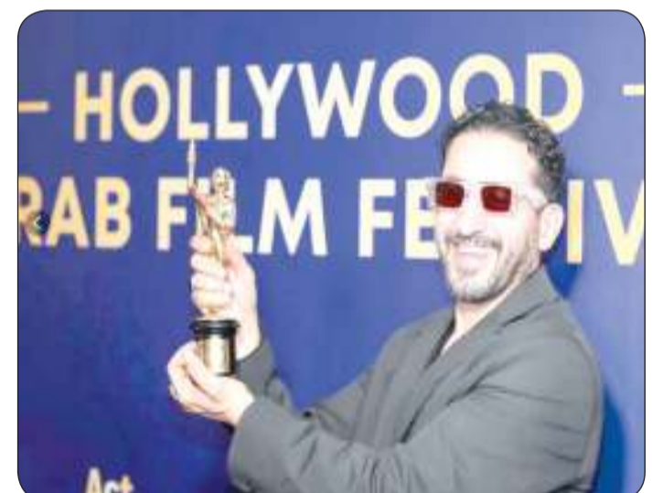
■ تكريم أحمد حلمي في أمريكا

الأفلام العرب ولتعريف الجمهور الغربي بالسينما العربية وصناعها. يذكر أن أحمد حلمي يعمل حاليًا على التحضير لفيلم جديد يجمعه الفنانة هند صبري ومقرر بدء تصويره خلال الأسابيع القليلة المقبلة، حيث يعود حلمي بهذا الفيلم إلى السينما بعد غياب 3 سنوات وتحديدا منذ تقديم فيلم «واحد تاني» الذي تم عرضه في موسم أفلام عيد الفطر 2022، وحققت إيرادات اقترنت من 65 مليون جنيه وقت عرضه، وهو الرقم الأعلى في مسيرة حلمي السينمائية.