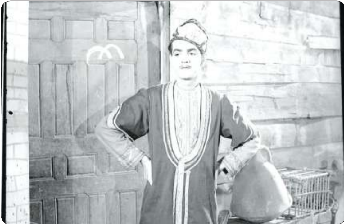
في فيلم «على بابا والاربعين حرامى»

محمود الشريف وكلمات حسين طنطاوى وغناها عبد المطلب بالصدفة فما هي قصة هذه الأغنية الأنجح في تاريخ الأغاني الشعبية على المستوى العربي قصة الأغنية