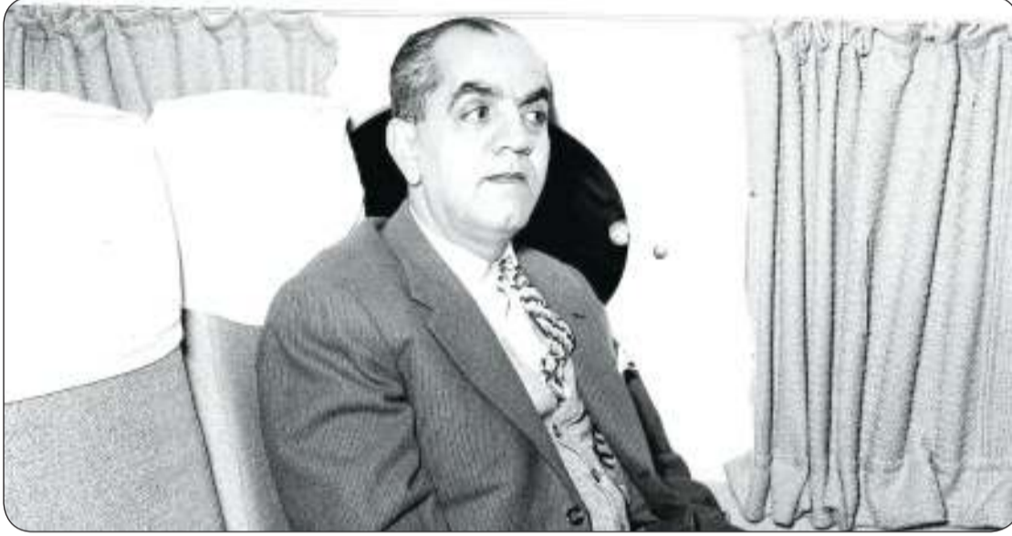
ملك المواويل محمد عبد المطلب

مقطع انتظار المدفع حفد أيضا لطول المدة من أجل التسجيل التلفزيوني حين غناها محمد عبدالمطلب في التلفزيون وأصبحت كلمات الأغنية كما تغني حاليا رمضان جانا وفرحنا به بعد غيابه ويقال له زمان غنوا وقولوا شهر بطوله غنوا وقولوا أهلا رمضان رمضان جانا أهلا رمضان قولا معنا أهلا رمضان بنغيب علينا وتهجرنا وقلوبنا معاك وفي السنة مرة تزورنا وبنستناك من امتي واحنا بنحسبك ونوضبك ونرتبك أهلا رمضان قولوا معنا أهلا رمضان.