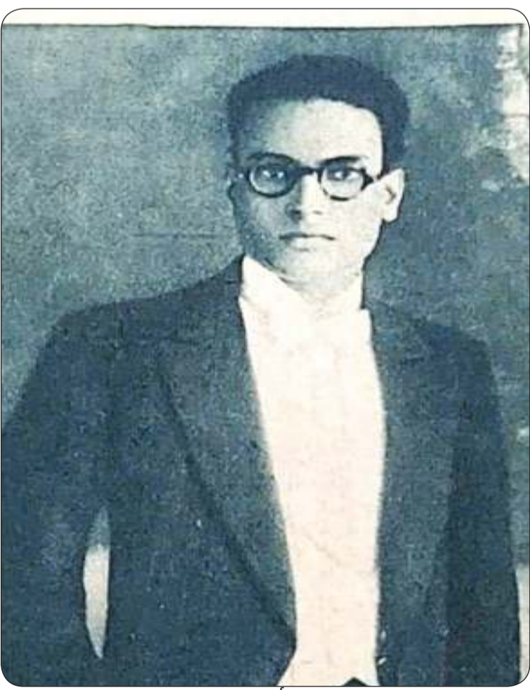
المطرب أحمد عبد القادر

المصريون القدماء كانوا يرحبون بالقرم مطلع كل شهر بكلمة «إياح» وتعني القمر و«وحوي» وتعني مرحي