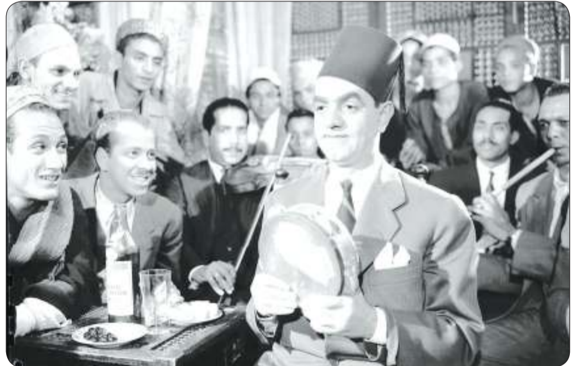
في فيلم «بنت الاكابر»