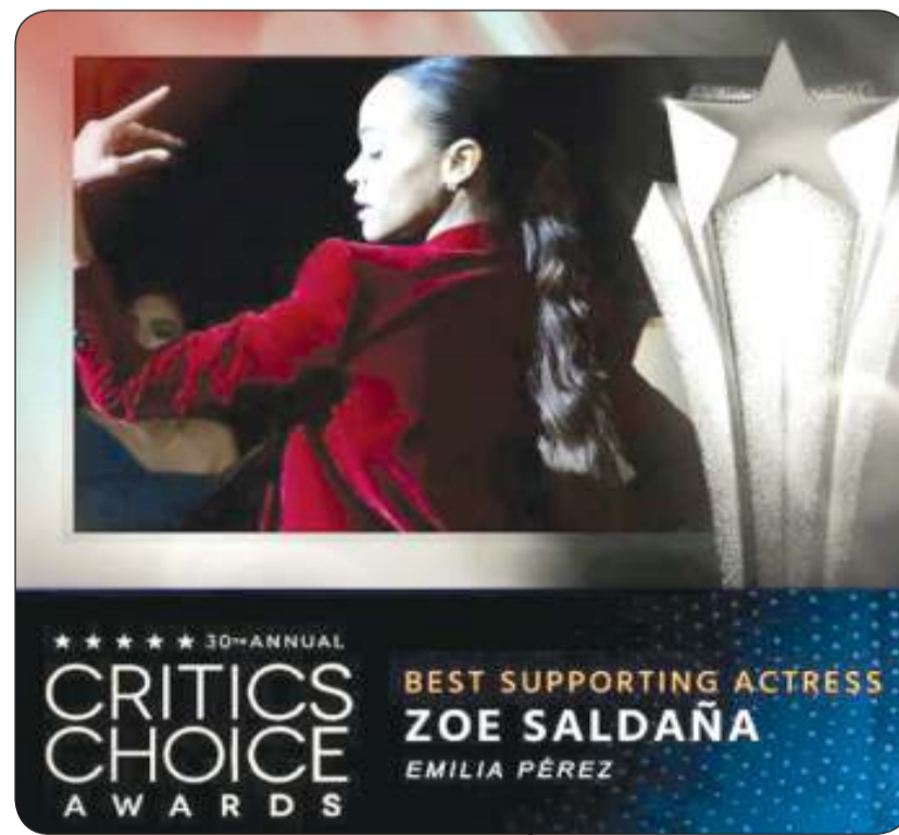
سالدانا أفضل ممثلة مساعدة