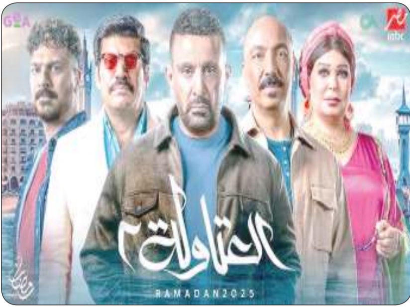
بوستر مسلسل «العتاولة 2»