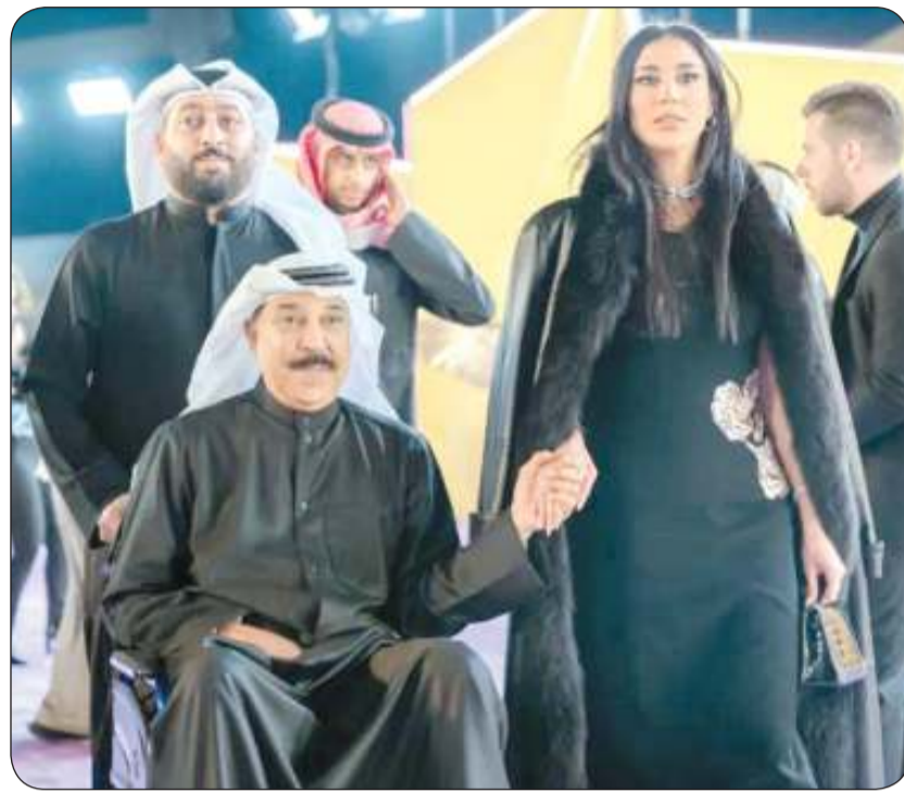
عبد الله الرويشيد على كرسي متحرك

المهتمين بصناعة الفن والترفيه لعل أبرزهم سمية الخشاب، جومانا مراد، نادية الجندي،