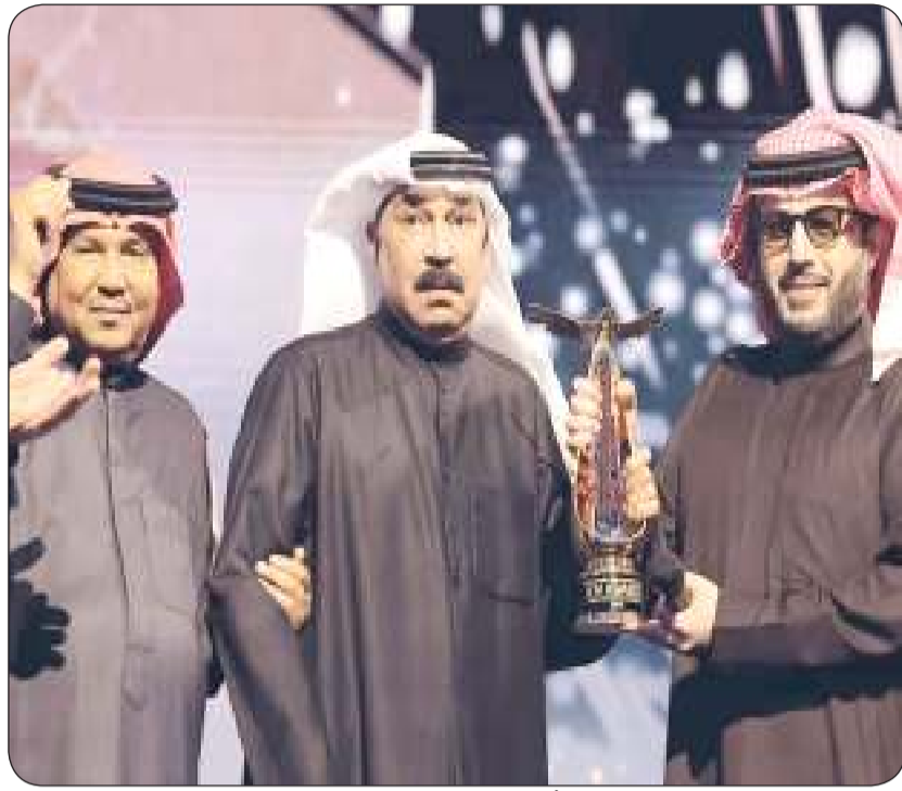
بين تركي آل شيخ وفنان العرب ممسكا بذراعه

هو Joy Awards، أضخم حفل يحتفي بصناع الترفيه في العالم العربي في مجال الفن والسينما والدراما والموسيقى والرياضة، ويقام الحفل ضمن فعاليات موسم الرياض، حيث يرشح فيه أفضل الفنانين والفنانات في مختلف المجالات، ضمن ثلاث عشرة جائزة، ويجمع ألمع النجوم والمشاهير في مكان واحد، ويتضمن عروضاً ومراسم متنوعة. يذكر أن النسخة الرابعة أقيمت في يناير 2024، بمشاركة كوكبة كبيرة من نجوم الفن والسينما والدراما والرياضة العرب والعالميين، إلى جانب أبرز صناعات الترفيه والمحتوى الإعلامي والفاعلين في هذا القطاع الحيوي، بموازاة حضور حشد من أهل الصحافة والإعلام العرب والعالميين، والمؤثرين الاجتماعيين، والشخصيات العامة وغيرهم.