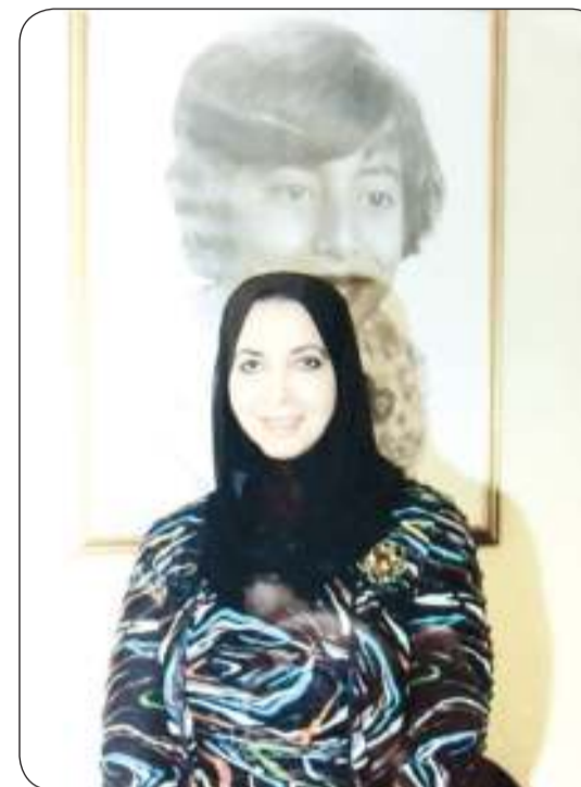
د. سعاد الصباح

إلا من كلمات كثيرة ألقها الدكتورة سعاد الصباح في مناسبات ثقافية وفكرية متعددة، في أزمنة مختلفة، وفي غير عاصمة عربية. ولما كانت هذه الكلمات شواهد على وقائع ثقافية متنوعة، وملاحم زمنية مختلفة شملت نحو نصف قرن، وبما أنها تثار على مديات متباعدة من الستين والعقود، وكان من الصعب على المهتم استحضارها من مظاهرها المختلفة، برزت فصيحة جمعها في هذا الكتاب لتكون بمثابة كل باحث ومهتم في