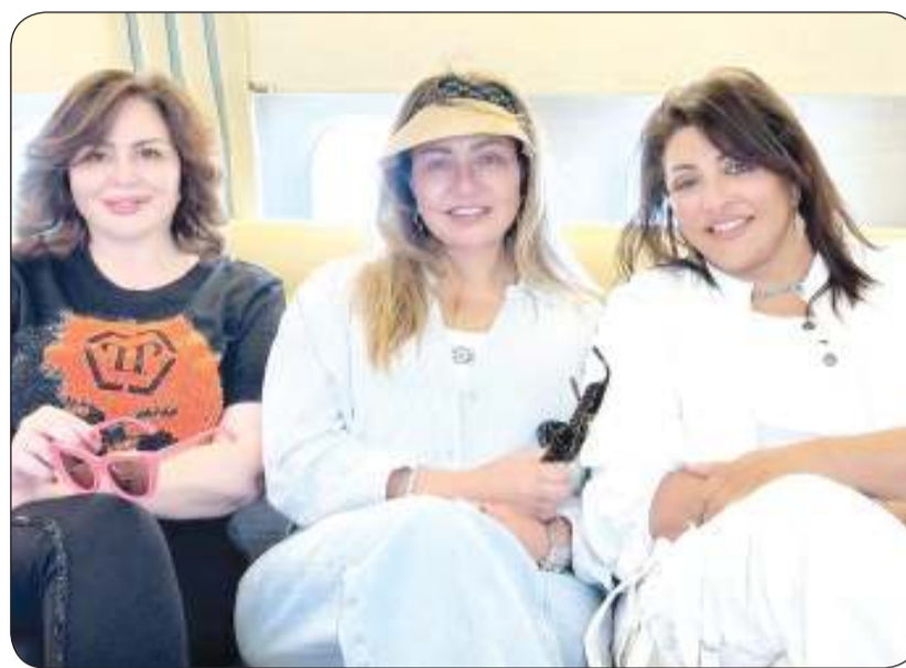
إلهام شاهين وليلى علوي وهالة صدقي

كشفت النجمة إلهام شاهين مفاجأة للجمهور بالإعلان عن تعاقدها على فيلم جديد يجمعها بالفنانات ليلى علوي وهالة صدقي، وذلك بعد مرور 28 عاماً على فيلمهن الشهير «يا دنيا يا غرامي».