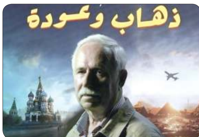
بوسنر فيلم «زهاب وعودة»