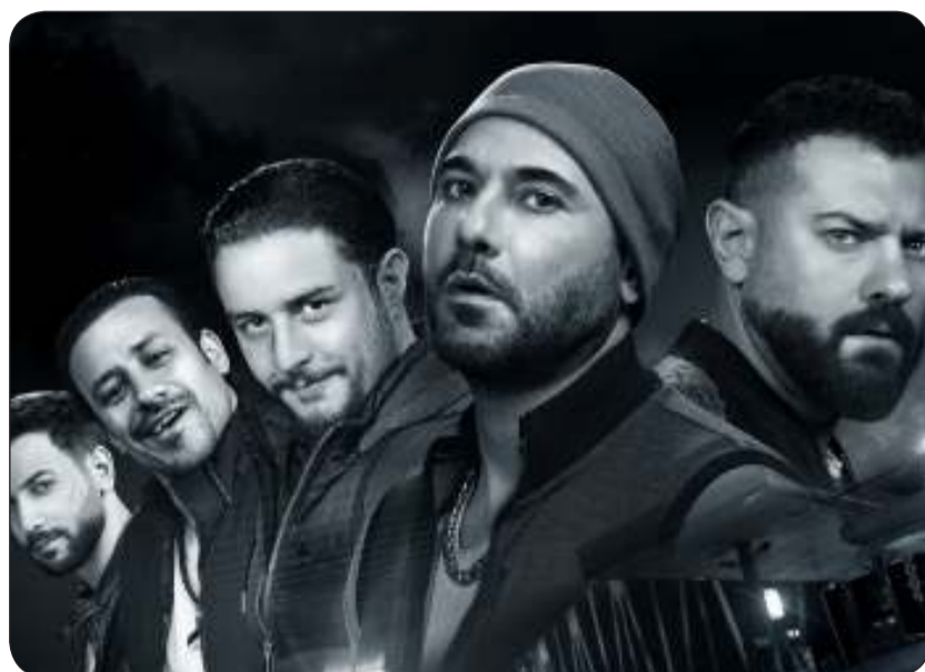
بوستر فيلم أولاد رزق

كشف المخرج طارق العريان عن سفره وفريق عمل فيلم «أولاد رزق» إلى الرياض، لوضع المسامات الأخيرة والتحضيرات النهائية، لبدء تصوير الجزء الثالث في الأيام القليلة المقبلة، بمشاركة نجوم الفيلم أحمد عز وعمرو يوسف وأحمد الفيشاوي وأحمد داود بالإضافة إلى ثلاثة نجوم عالميين، من بينهم شخص رياضي سيكون له دور مهم، ويمثلة عالمية ستشارك أيضا في العمل.