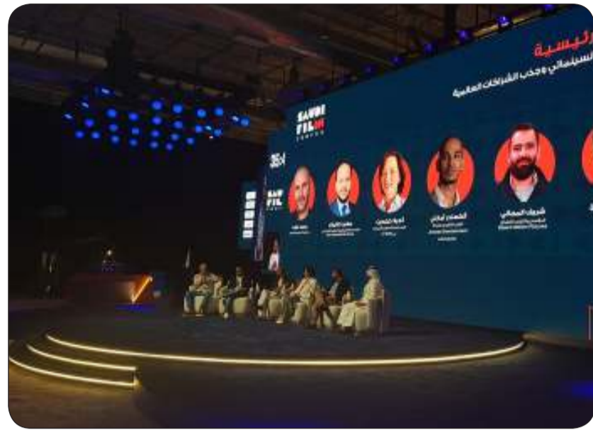
المخرج وكاتب السيناريو محمد دياب أثناء مشاركته في الجلسة الحوارية ضمن منتدى الأفلام

التي هي منجم للقصص، وفي نفس الوقت أهتم بالقصص التي كما قلت سابقاً تقرب البشرية من بعضها البعض من خلال الثقافة.»