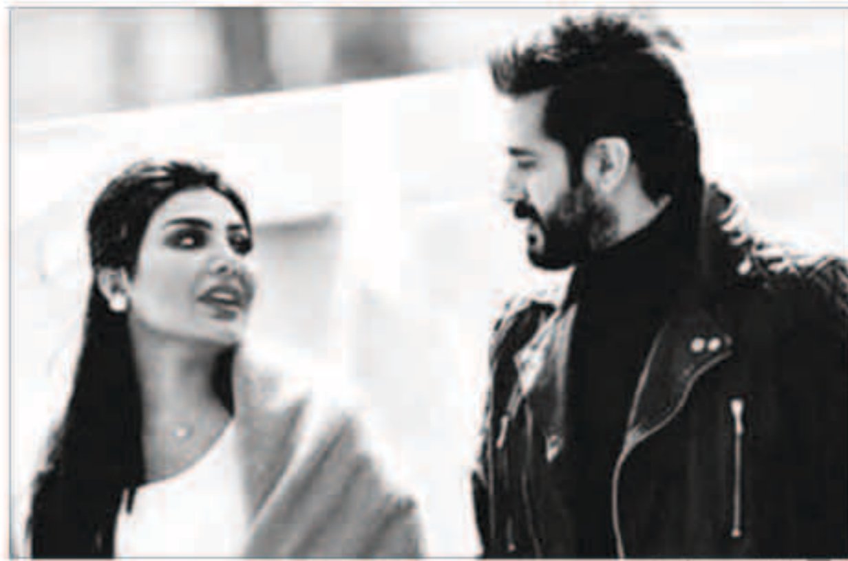
أمل العوضي وعبد الله بو شهري

يلتقي الثنائي الممثلين أمل العوضي وعبد الله بو شهري للمرة الأولى، في مسلسل حب في اسطنبول، للمخرج خالد الفضلي.