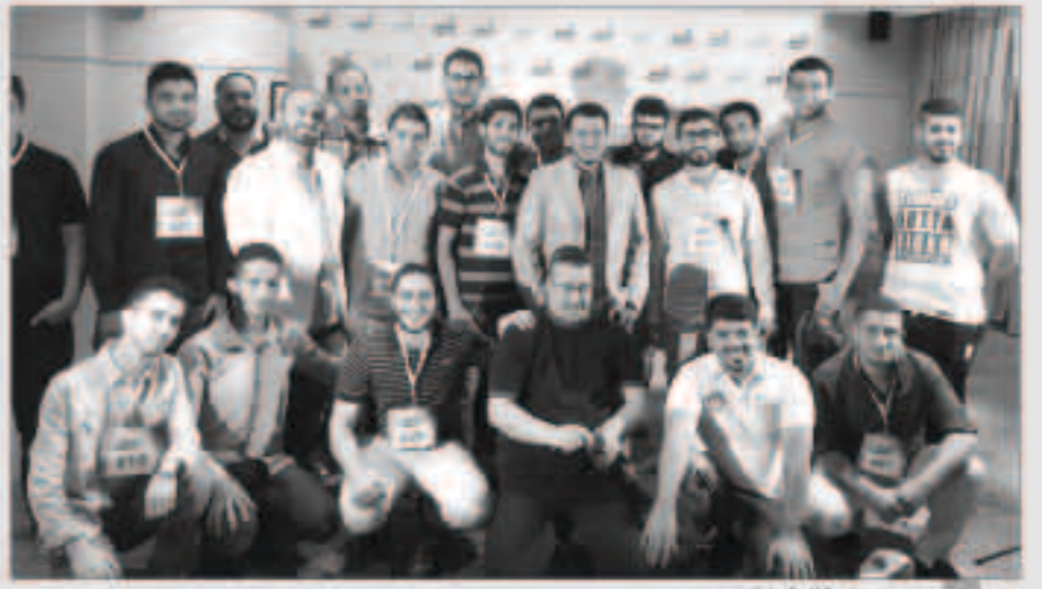
صور جماعية للمتسابقين

مخلت للمملكة الأردنية الهاشمية المحطة الثالثة لبرنامج «منشد لشارقة» الذي تقدمه مؤسسة الشارقة للإعلام، في جولته الخارجية. حيث التقت لجنة الاختبارات البرنامج الذي يقام تحت رعاية كريمة من صاحب السمو الشيخ الدكتور سلطان بن محمد القاسمي، عضو المجلس الأعلى حاكم الشارقة، مع مجموعة كبيرة من عشاق الفن الهادف الذين تقدموا للمشاركة في الموسم التاسع من البرنامج. وكانت لجنة الاختبارات قد اجتمعت في قاعات فندق انتركونتيننتال مع أكثر من 40 متسابقاً جاؤوا من مختلف مناطق العاصمة الأردنية عمان، بالإضافة إلى مدن إربد والزرقاء ومنطقة الأغوار. كما التقت اللجنة في عمان عدداً من المتسابقين الذين مثلوا الجنسيات العراقية