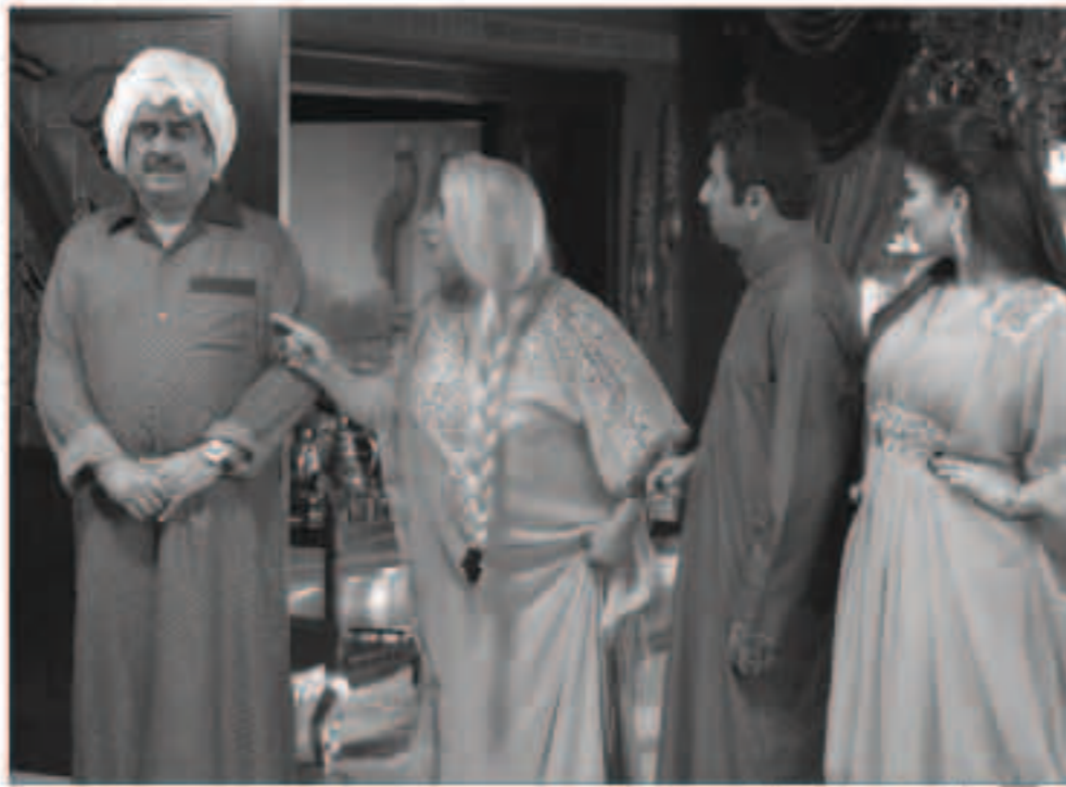
ربة مشهد من مسلسل «أبو الملايين»