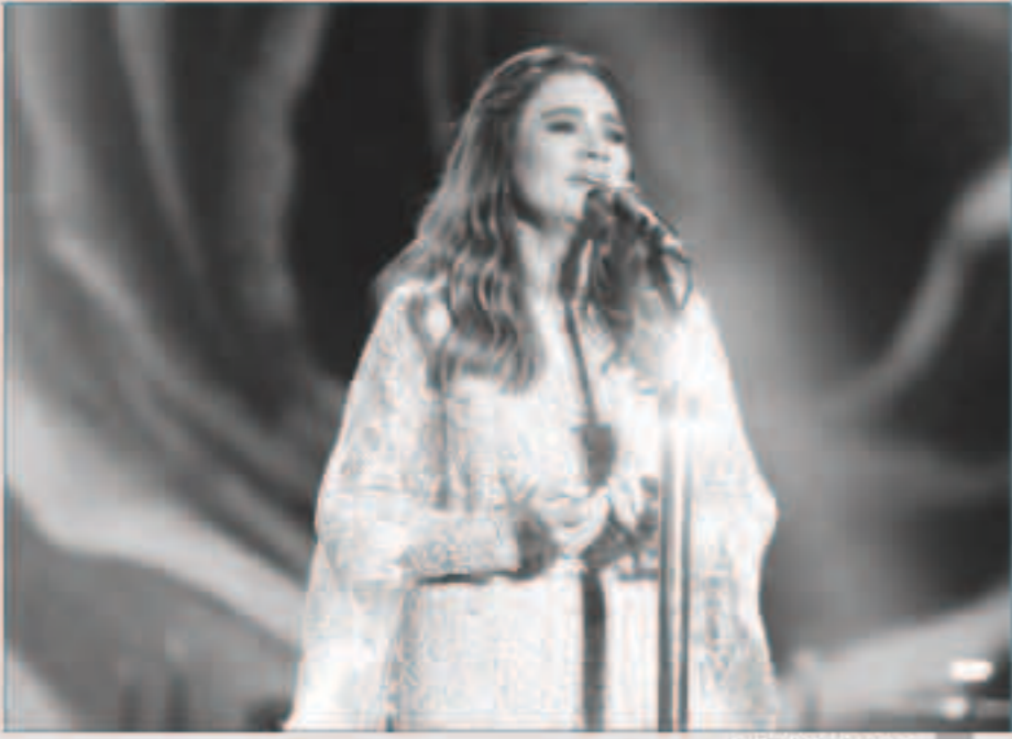
جوليا بطرس خلال الحفل

اكتشفت واجهة بيروت البحرية بحشود غفيرة جاءت بالآلاف من عدة مناطق لبنانية وبعض الدول العربية لحضور حفل الفنانة جوليا بطرس. وحضر الحفل عدد من الوجود الرسمية على رأسها زوجها الوزير الماس بو صعب، وستريدا جعجع، وسليمان قرنيج، وزوجته ريم، وممثلو عدد من الوسائل الإعلامية اللبنانية. بدأت جوليا بالسؤال «وينك يا الياس؟» «بدي لك حباتي شكراً لأنك دائماً تتحقق لي أحلامي»، وكانت تعني لزوجها الوزير الياس بو صعب. كما غنت جوليا من البومها القديم والجديد، نذكر من القديم «أنا بنتفس حورية»، «يا قصص»،