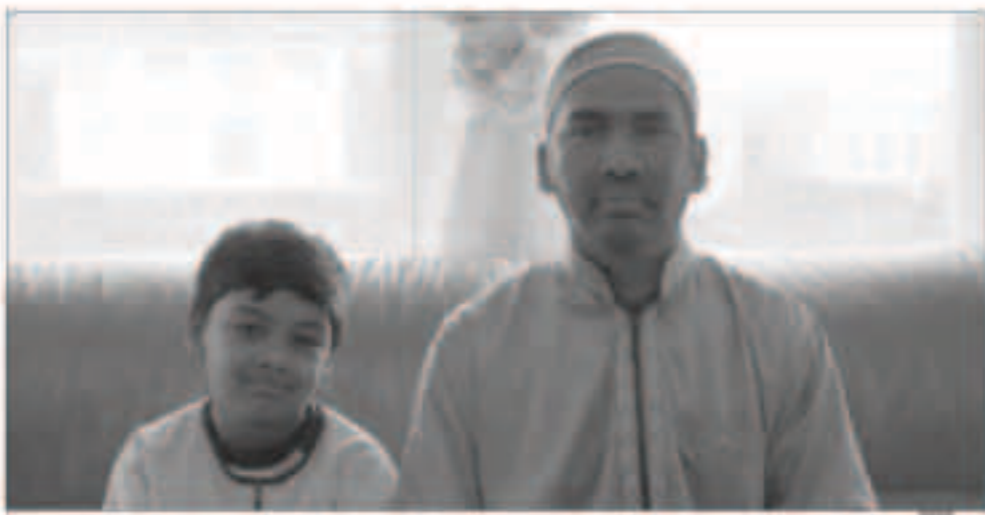
مشهد من فيلم «سلام»

التي تشارك بها السعودية في هذه المسابقة الدولية الهامة. من جهة أخرى حسب «العربية نت» أنه سيتم تكريم الفائز في هذا العام في شهر أكتوبر المقبل في حفل يقام في نيويورك. وجاء ترشيح البدران للجائزة من أصل 300 مشاركة، وقد نحت الجائزة من قبل جهة داعمة للمسابقة هي مؤسسة «ماري كنول» المختصة بفضايا الحوار بين الأديان في أميركا. يذكر أن المخرج الشاب منصور البدران كان قد حقق العديد من الجوائز في مجموعة من تجاربه السينمائية السابقة، من بينها جائزة فيست كاتفيل فيلم يجسد التنوع العرقي والثقافي في مهرجان برينير العاشر في شيكاغو المنظم من جامعة بيبول عن فيلمه طائر الدمام.