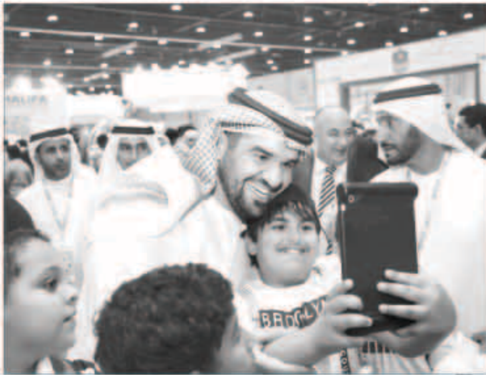
حسين الجسمي وصيغلي مع الأطفال

برعاية صاحبة سمو الشقيقة فاطمة بنت مبارك رئيسة الاتحاد النسائي العام الرئيس الأعلى لمؤسسة التنمية الأسرية الرئيس الأعلى للأومومة والطفولة، وبحضور معالي الدكتورة ميثاء سالم الشامسي وزيرة دولة، يرافقها معالي المهندس حسين الحمادي وزير التربية والتعليم، وسعادة مبارك سعيد الشامسي مدير عام مركز أبوظبي للتعليم والتدريب التقني والمهني، شارك «السفير فوق العادة للتواياح الحسنة» الفنان الدكتور حسين الجسمي في تدشين الدورة الخامسة لمهرجان «المرح للصحة واللياقة 2016»، الذي ينظمه مركز أبوظبي للتعليم والتدريب التقني والمهني، لمدة ثلاثة أيام في مركز أبوظبي الوطني للمعارض، بمشاركة 65 مؤسسة محلية وإقليمية ودولية متخصصة في مجالات الصحة واللياقة، منها وزارة الصحة وكلية فاطمة للعلوم الصحية ومجلس أبوظبي الرياضي، وغيرها من المؤسسات التي قدمت فعاليات متنوعة للجميع بالجان، كشفت من خلالها عن الأنماط الصحية للحياة السعيدة، والوسائل الرياضية التي يتم عن طريقها ضمان تمتع أفراد المجتمع بالصحة والقدرة العائنة على العمل المبدع والنشاط الدائم، مؤكداً بعد قس شريط الافتتاح مع السادة الوزراء، أن مشاركته جاءت من إهتمام سمو الشقيقة فاطمة بنت مبارك آل نهيان لمختلف الفعاليات الهادفة وتدفق عطائها في كافة الميادين من أجل مجتمع إماراتي مبدع يتمتع أفراداه جميعاً بموقور الصحة والعيش السعيد.