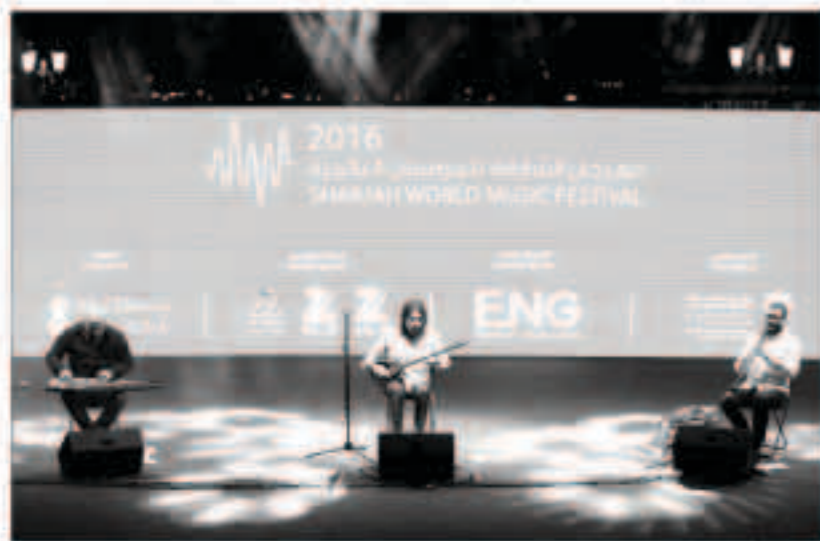
ثلاثي تقسيم يقدمون مقطوعات موسيقية تركية وشرقية في جزيرة العلم