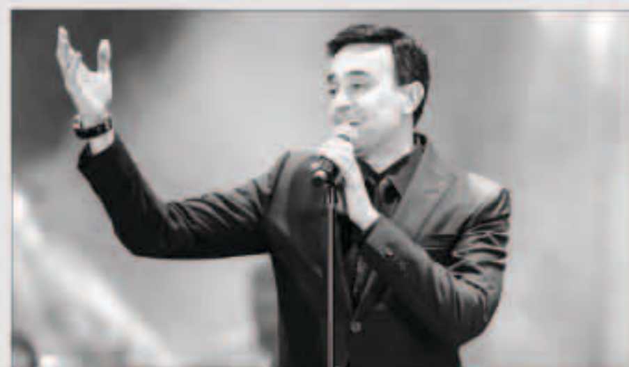
صابر الرباعي على مسرح الحجاز

من ناحية أخرى، تلقى صابر في الحلقة، مقدما عددا من اغنياته بدءا من «بيسطة»، «فديا عسل»، و«يا للاء»، و«دولة»، و«مزينة»، وصولا إلى «اجعل نساء الدنيا»، و«على نار»، و«عز الحباب»، و«فدك الحباس»، من جهتها، تقدمت إدارة «مهرجان الشارقة للموسيقى العالمية»، بالشكر والتقدير للفنان الكبير صابر الرباعي على الامة الفنية الرائعة التي احياما على «مسرح الحجاز» في الشارقة. وشاركت إدارة المهرجان بالمستوى الفني الكبير والراقي الذي قدمه الفنان على مدار أكثر من سائتم، إذ شهدت الامة تفاعلا كبيرا من قبل الجماهير التي توافدت إلى مسرح «الحجاز» للاستمتاع بصوت «أمير المطرب العربي». وحول التصرف غير اللائق الذي صدر عن أحد الحضور في ختام الحلقة، أوضحت إدارة المهرجان بان هذا التصرف شخصي ولا يمثل إلا الشخص الذي قام به، وأكدت ان الجهات الأمنية قامت مباشرة بالتحفظ على الشخص وبدأت بالتحقيق في الحادثة، على ان يتم اتخاذ الإجراءات القانونية بحقه.