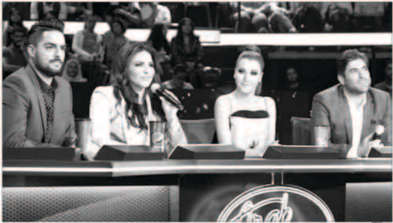
لجنة تحكيم أراب آيدول

نوعاً - المُشاهد العربي على موعد مع بدء عرض عدد من برامج المسابقات الغنائية التي ستلحق الشاشة الصغيرة تزامناً مع بدء دورة برامج الخريف من ضمنها برامج سوق عرضها وستعود بمواسم جديدة وأخرى سنشاهدها في نسخة أولي.