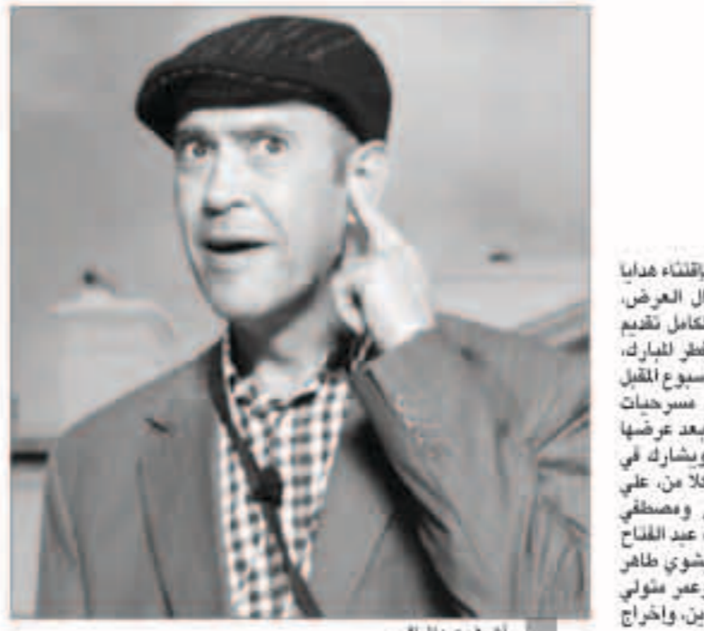
أشرف عبد الباقي

نجح الفنان أشرف عبد الباقي في إعادة للمسرح منافسة السينما على جذب الجمهور في العيد لأول مرة منذ سنوات طويلة لفت إليها السينما تشييد لوقوف بمنافسة محدودة للغاية من جانب عروض مسرح الدولة. وعلى مدى السنوات الخمس - أو ربما أكثر قليلاً - أخذت عروض المسرح الخاص في العيد لتفتح الطريق أمام السينما التي كانت الوسيلة الوحيدة لتزلفه الفني عن جمهور العيد إلى جانب عدد من العروض القليلة بمسارح الدولة. لكن الفنان أشرف عبد الباقي خاض المنافسة في موسم العيد بعرضين مسرحيين قدمهما على خشبة مسرح بجاردن سيني. وكانت المفاجأة أن جذب جمهوراً غفيراً ملا حثبات المسرح طوال أيام العيد في مفاجأة ربما لم يتوقعها أحد. وبدأ الموسم المسرحي الجديد بتقديم عرضين في نفس المسهرة، الأول بعنوان «العجوز والنكز»، والثاني بعنوان «طابور عرضش»، ولاتي العرضان طوال أيام العيد إقبالا جماهيرياً كبيراً فاق