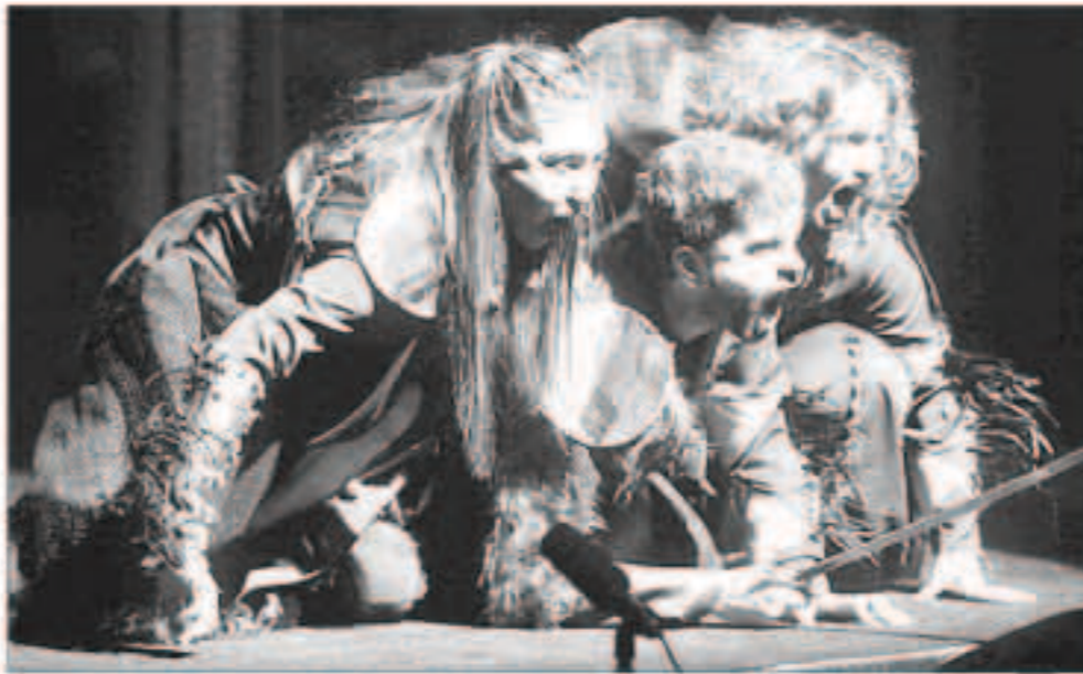
في مسرحية «من منهم هو»