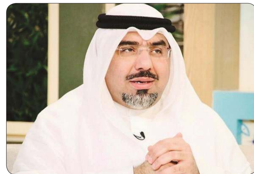
الأمين العام المساعد لقطاع الفنون مساعد الزامل

للفرق الأهلية والحكومية وشركات ومؤسسات الإنتاج المسرحي، التي ترغب في المشاركة في