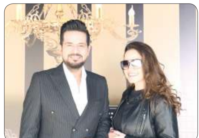
حاتم العراقي في لقطة من الكليب

وقال: «أغنية «بعد حبي» تحمل الفرح والمحبة في كل أطرافها ابتداءً من الكلمات واللحن والإيقاعات وطريقة التصوير أيضاً البعيدة عن الدراما، وأكد أنه متفائل جداً بالعمل وهو الوقت المناسب لطرحة أمام الجمهور. وقد جدد حاتم العراقي من خلال أغنية «بعد حبي» تعاونه مع الشاعر العراقي حازم جابر، وقام بتلحين الأغنية الملحن العراقي علي جاسم، وأسندت مهمة التوزيع والمكس والماسترنج للموزع العراقي «حسام الدين». وقد تم توزيع الأغنية عبر جميع الإذاعات العراقية والعربية، إلى جانب طرح الفيديو كليب في قناة حاتم العراقي الرسمية وجميع وسائل التواصل الاجتماعي الرسمية الخاصة به.