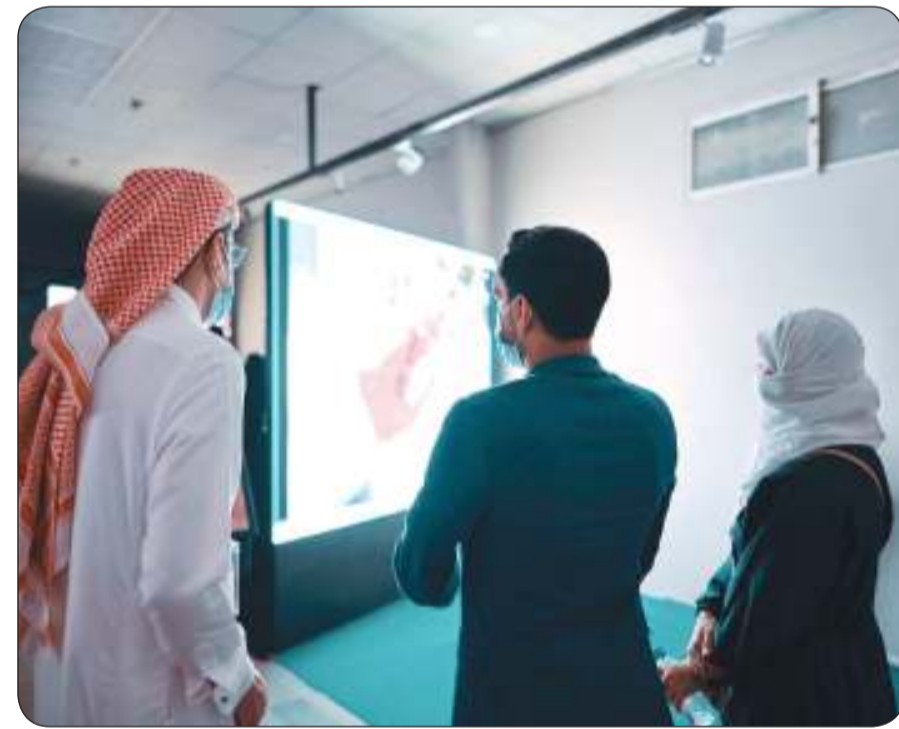
جولة داخل المعرض