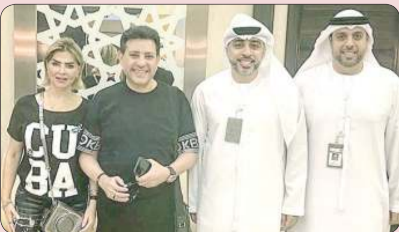
هاني شاكر يحصل على الإقامة الذهبية في الإمارات

أعلن الفنان هاني شاكر، نقيب الموسيقيين، خبر حصوله وزوجته على الإقامة الذهبية من إمارة دبي، وذلك عبر حساباته على السوشيال ميديا. وقد نشر الفنان هاني شاكر صوراً له مع زوجته بعد حصوله على الإقامة الذهبية عبر حسابات على «تويتر» و«فيسبوك» و«انستقرام»، وأرفقها بتعليق: «كل الشكر والتقدير لدولة الإمارات الحبيبة على هدية الإقامة الذهبية لي ولزوجتي، وتمنياتي لدولة الإمارات الحبيبة شعباً وحكومة بدوام النجاح والازدهار». وتمنح التأشيرة الذهبية للمستثمرين ورواد الأعمال وأصحاب المواهب التخصصية والباحثين في مجالات العلوم والمعرفة، بهدف تسهيل مزاولة