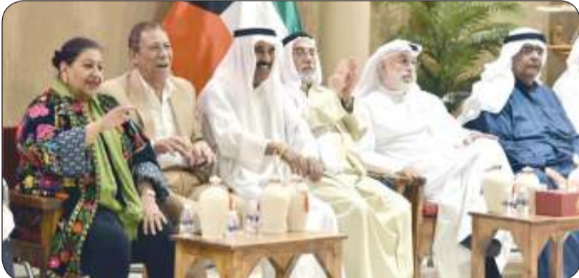
حضور فني واعلامي لافت