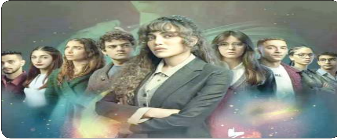
نجوم مسلسل «أثينا»

المسلسل دراما نفسية ويتناول تأثير تطور التكنولوجيا على المجتمع خاصة جيل الشباب