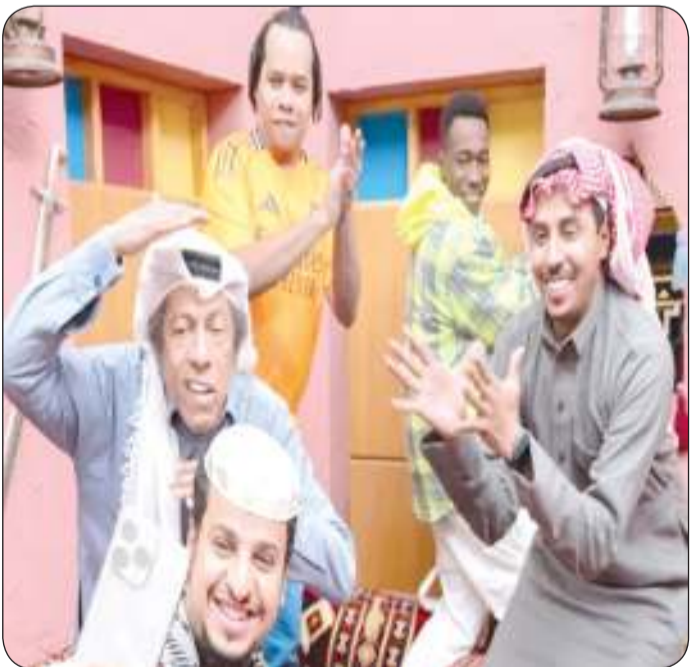
فريق «شباب اليوم»