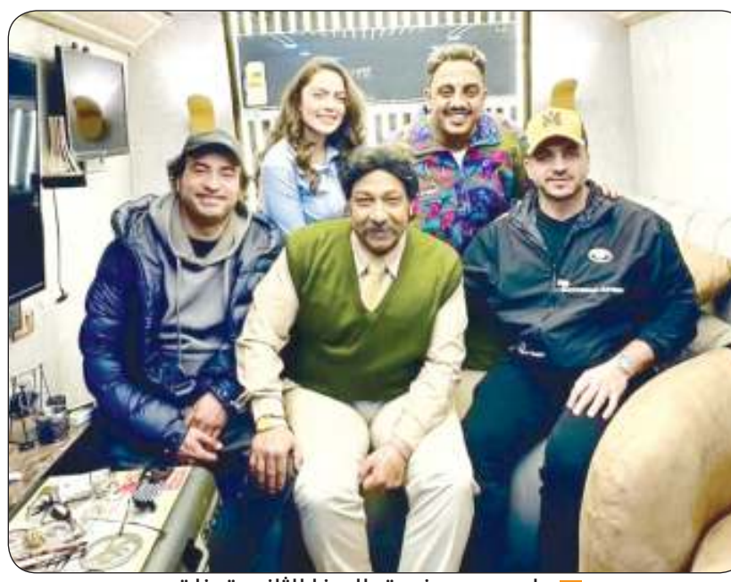
علي ربيع وفريق الصفاء الثانوية بنات

شريف نجيب، وإخراج خالد الحقاوي. علي ربيع ينضم لقائمة نجوم الموسم فيلم «الصفاء الثانوية» للفنان علي ربيع انضم للقائمة، حيث يكشف أبطاله على تصوير مشاهد للعرض في عيد الفطر حسبما أعلن صناعه مع انطلاق التصوير، والفيلم يشارك في بطولته كل من: أوس أوس، بيومي فؤاد، محمد ثروت، هالة فاخر، سارة الشامي وثام مجدي، إسماعيل فرغلي، جيسكا حسام، لينا صفويا، أسراء رخا، والفيلم من تأليف أمين جمال ووليد أبو المجد وإخراج عمرو صلاح وإنتاج أحمد السبكي.