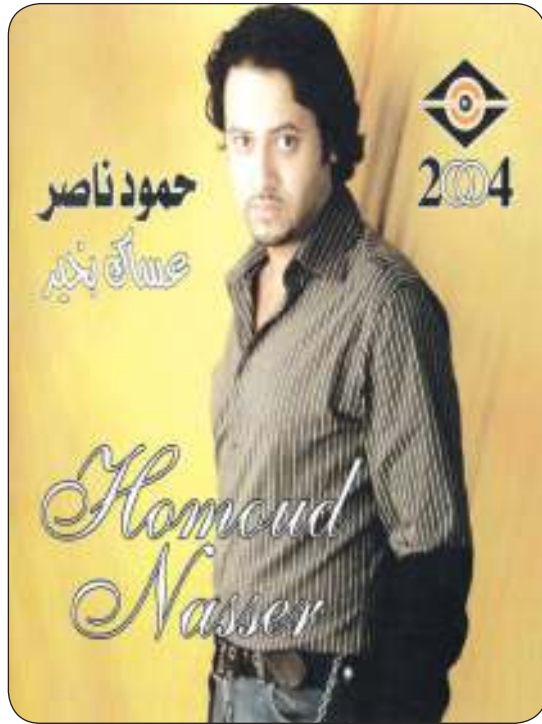
حمود ناصر في أغنيته «عساك بخير»

كان فنانا سابقاً لعصره وجيله وطور من شكل الأغنية الكويتية