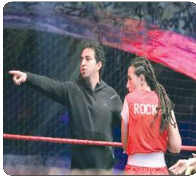
دنيا سمير غانم ومحمد أحمد السبكي