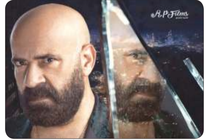
محمد سعد في الدشاش

فيلم «تتح» الذي تم عرضه في عام 2013، وشارك في بطولته دولي شاهين، سيد رجب، مروى، هياتم، وعمر مصطفى متولي، ومسلسل «فيفا أطاطا» الذي تم عرضه في رمضان من عام 2014، وشارك في بطولته إيمي سمير غانم وسامي العدل وأحمد فتحي، إضافة إلى برنامج «وش السعد» الذي عرض في عام 2016. وفي السياق نفسه حرص الفنان محمد سعد على توجيه الشكر للفنان أحمد حلمي على دعمه لفيلم «الدشاش» الذي يعود به سعد إلى السينما بعد غياب 5 سنوات، حيث قال محمد سعد على هامش العرض الخاص للفيلم: «أحمد حلمي أصله حبيبي وفكرني بإيام المعهد بالتهنئة بتاعته دي، أحمد طبعاً أخويا وحبيبي وانبسبت جدا بالكلام اللي نزله ورديت عليه وكنت عاوز أروحله في نفس الوقت بالليل».