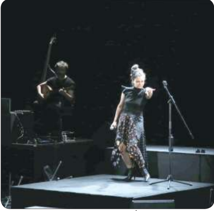
مشهد من عرض «صمت»