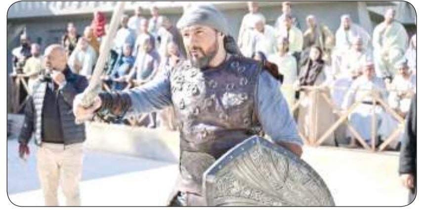
ياسر جلال في جودر 2

انتهى الفنان ياسر جلال من تصوير آخر مشاهد الجزء الثاني من مسلسل «جودر 2» المقرر عرضه خلال الموسم الدرامي الرمضاني المقبل ويتكون من 15 حلقة وحرص ياسر على توجيه الشكر لكل فريق العمل وعلى رأسه المخرج إسلام خيرى بعد ما يقرب من 3 سنوات