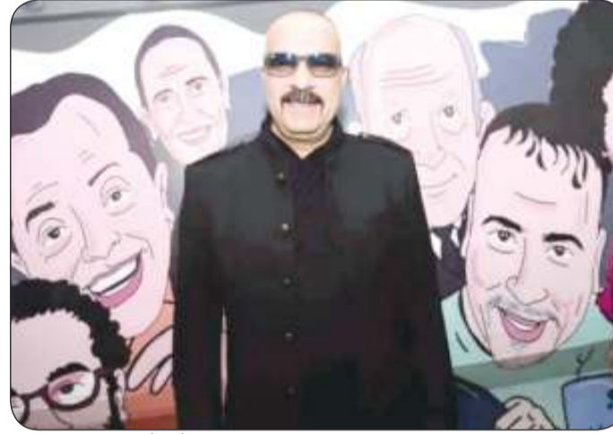
سعد في العرض الخاص للدشاش

عشاق الرياضة في حفل نادي الاتحاد اجتمع عشاق الرياضة والموسيقى تحت سقف واحد، في ليلة كانت أشبه بكرنفال ثقافي وفني، حيث امتزجت أصوات الجماهير مع أغاني حسين الجسمي في مشهد يعكس عمق الحب والانتماء لنادي الاتحاد، ليبدأ الجسمي الحفل بأغنية «يا الاتحاد» التي قدمها الجسمي للنادي في 2019، لتعبر عن مجد نادي الاتحاد السعودي وتاريخه العريق.