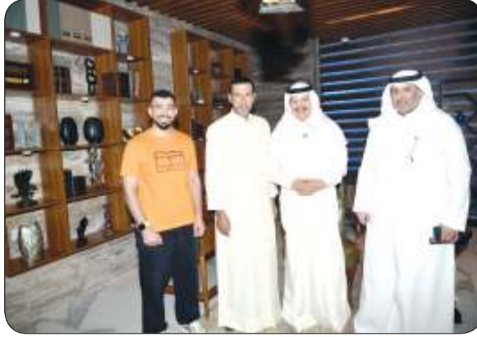
الجاسم مع فريق البرنامج