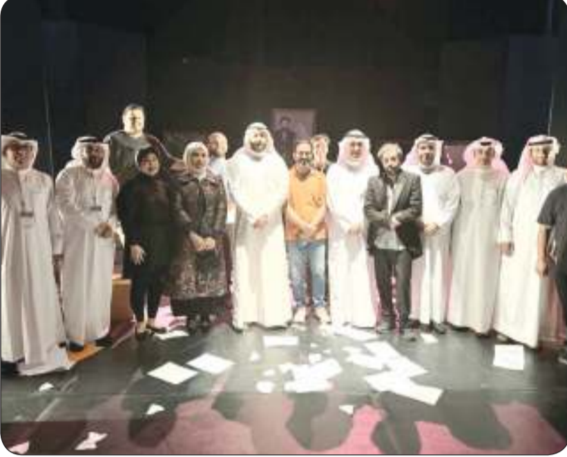
سفيرنا لدى الأردن يتوسط فريق عمل المسرحية