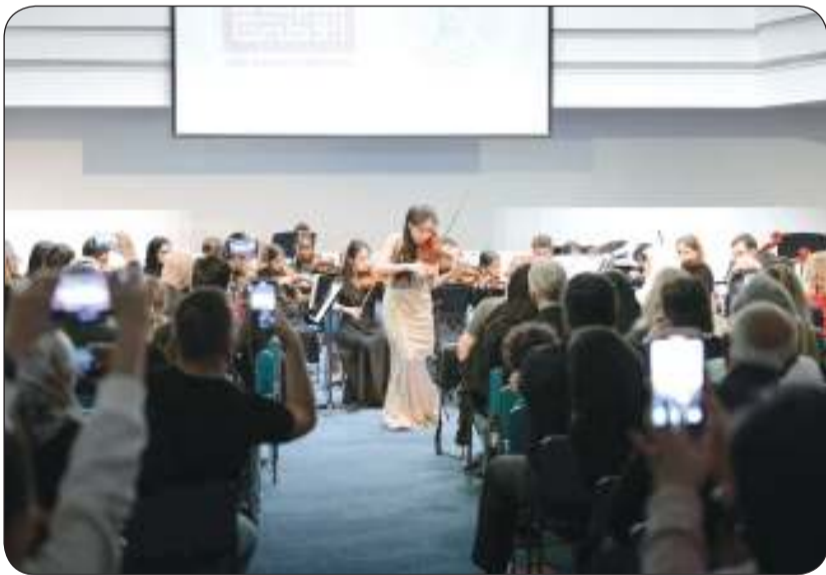
جانب من الأمسية الموسيقية

العربية المتحدة، وهي فرصة لا تفوت لرؤية هذه المهلة الاستثنائية في تدريبها الإبداعي مجموعة متميزة من الموسيقيين على مسرح المدرسة البريطانية في الخبرات التي أتاحت الفرصة لهذه المواهب لتقديم أمسية شديدة التميز. وعملت تزو مع 22 موسيقياً شاباً من الإمارات خلال الفترة من 5 إلى 9 فبراير، تم اختيارهم بعناية سعياً لصقل مواهبهم الإبداعية، وخضعوا لدروس متقدمة، وشاركوا في تدريبات مكثفة، وتوجت هذه الفترة التفاعلية، بالأمسية التي قدمت مواهبهم التي تعكس تميزهم وعلمهم الموسيقي إلى جانب المهبة العالمية تزو.