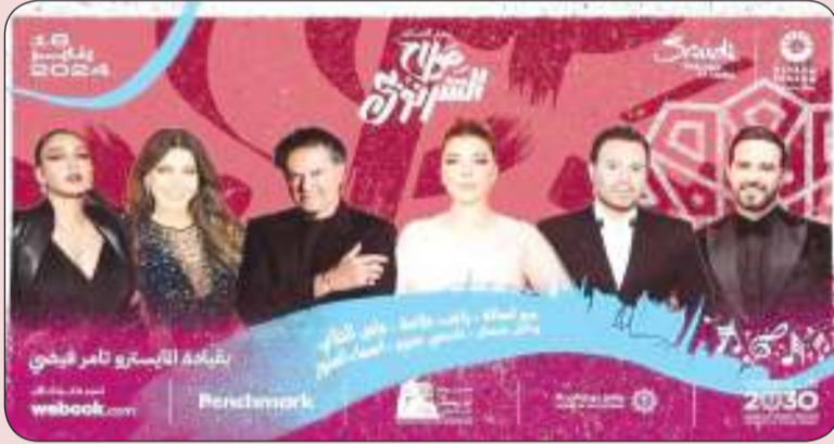
نجوم «ليلة صلاح الشرنوبي»

تقام مساء اليوم الخميس، ليلة غنائية خاصة في الرياض، احتفاء بالمسيرة الفنية للموسيقار المصري صلاح الشرنوبي، الذي يشهد بنفسه على بروفات الليلة وتحضيراتها. وتحسب عنوان «الحنان صلاح الشرنوبي»، يستعد 6 نجوم عرب لإحياء هذه الليلة، التي يحتضنها مسرح أوبكر سالم، ضمن فعاليات موسم الرياض بنسخته الرابعة. ويشترك في الحفل، كل من النجمة أصالة نصري، والنجوم راغب علامة، وعاصي الحلاني، ووائل جسار، ونانسي عجرم، والنجمة أسماء لمور، بقيادة المايسترو تامر فيضي. وقبل الليلة التكريمية بيوم، وجه موسم الرياض رسالة حب للموسيقار، بعنوان «إهداء من منسوبي موسم الرياض ومحبي الموسيقى الكبير صلاح الشرنوبي»، في مقطع فيديو ظهرت فيه مجموعة أشخاص يغنون «بتونس بيك» لوردة الجزائرية، لينتهي بغناء وتلحين الشرنوبي، خاتما المقطع بحملة «موسيقار الحانه عابرة للأزمان.. يظل صداها في كل مكان». وفي مقطع فيديو آخر، نشره رئيس هيئة الترفيه السعودية، تركي آل الشيخ، تضمن أغاني لحنها لشرنوبي، من بينها «كلام الناس» لجورج وسوف، و«سيدتي الجميلة» لراغب علامة، و«حرمت أحيك» لوردة الجزائرية، و«الله ياسيدي» لمحمد صالح، و«تصور» لأصالة، وغيرها، معلقا: «تستاهل يا صلاح وبندحك»، و«في حب صلاح الشرنوبي».