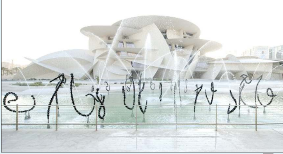
متحف قطر الوطني

والعاج والمرمر والمينا. وأوضح أن استخدام هذه المواد الثمينة والقطع الأثرية جعل من الممكن الحفاظ عليها وتخزينها آلاف السنين مضيافاً أنها تشهد على تراث فني ازدهر في منطقة الخليج وأثرى الإنجازات اللاحقة للفن الإسلامي. وأفاد بأن متاحف قطر تنفذ بروتوكولات الصحة والسلامة التي تشمل مطالبة الزائرين بشراء التذاكر مسبقاً على موقع متاحف قطر الإلكتروني وإبراز الحالة الصحية باللون الأخضر في تطبيق «أحتران» مع ضرورة ارتداء الكمامات طوال مدة الزيارة.