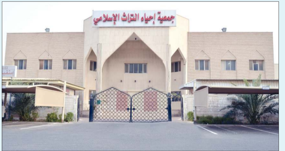
جمعية إحياء التراث

تقيم جمعية إحياء التراث الإسلامي دورة بعنوان: «حياتنا ووسائل التواصل الاجتماعي» للفتيات من الصف الخامس إلى الصف التاسع، والتي سيشرف عليها نادي (لينة) للفتيات في محافظة مبارك الكبير (القصور)، حيث ستبدأ فعاليات الدورة غداً، وستكون الدراسة فيها كل يوم أربعاء من الساعة (6-7) مساءً عبر برنامج «زووم». والمشاركة في هذه الدورة ستتم عن طريق الحجز على الواتساب 97751033.