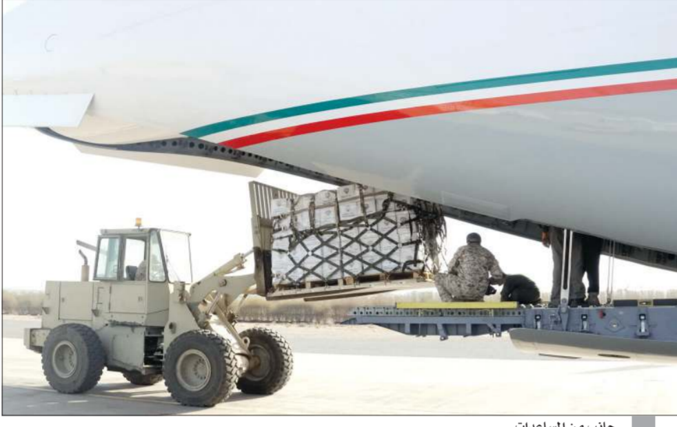
جانب من المساعدات