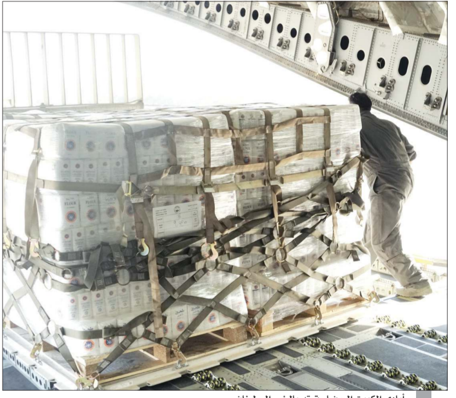
أيادي الكويت البيضاء تمتد بالخير إلى لبنان