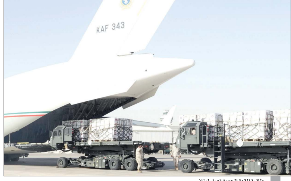
طائرة القوة الجوية تصل لبنان

■ «الدفاع» : تواصل جسر الإغاثة بطائرتين تابعتين للقوة الجوية الكويتية