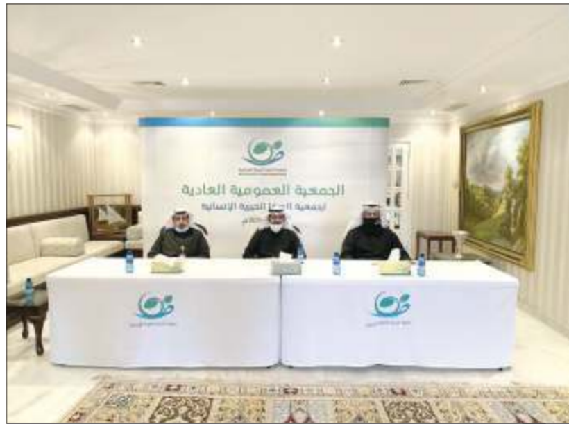
الجمعية العمومية العادية لجمعية الصفا الخيرية

الإداري والمالي للمشاريع الداخلية والخارجية، وقد تمت الموافقة على التقريرين الإداري والمالي، بعدما تمت مناقشة الميزانية التقديرية لعام 2020 والتصويت عليها بالموافقة. وفي نهاية اجتماع الجمعية العمومية شكر الشايح وزارة الشؤون ممثلة بإدارة الجمعيات الخيرية المبرات على تعاونها مع الجمعية