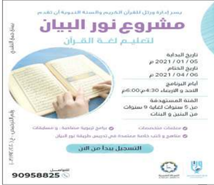
تعزيز وريادة في حفظ القرآن