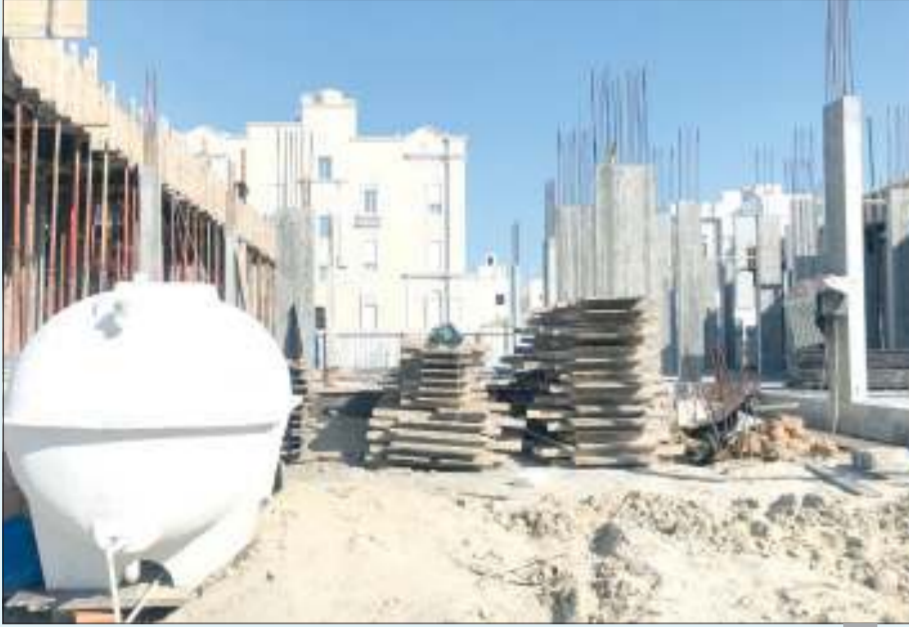
جانب من مخلفات الأنقاض

بالنوبه «ب» بتوجيه 5 تنبيهات لوجود أنقاض ودفان ، فيما قام الفريق الرقابي بالنوبه «ج» بتوجيه 24 تنبئها لوجود أنقاض ومواد دفان وبناء . ودعت بوشهري أصحاب العقارات المخالفات مقررة قانونا ، لافتة إلى أن الفريق الرقابي بإدارة السلامة لن يتهاون في إتخاذ كافة الإجراءات القانونية حيال أي مخالفة . ودعت إدارة العلاقات العامة المواطنين الاتصال على الخط الساخن 139 أو عبر مواقع التواصل الاجتماعي لبلدية الكويت @kuwmmun في حال وجود أي جهودهم تتعلق بالبلدية وسيتم إتخاذ الإجراءات القانونية حيالها على الفور .