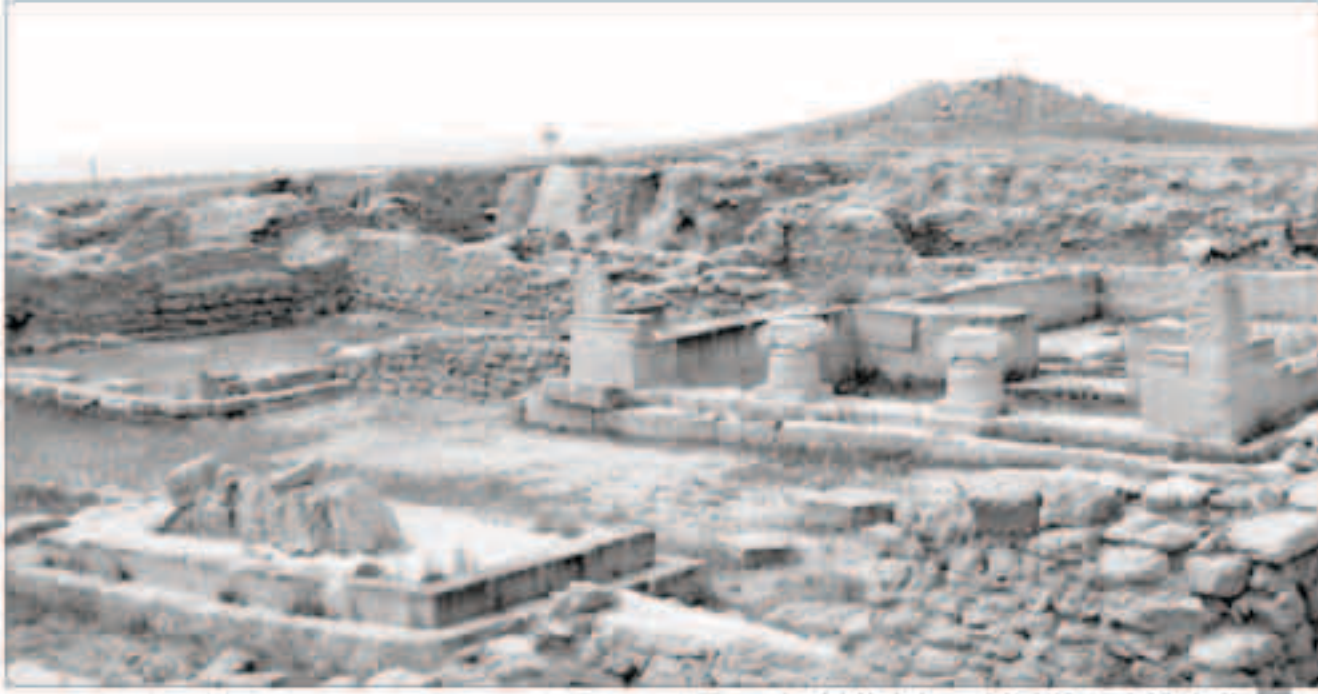
الجزيرة تعتبر مركزاً تراثياً وحضارياً عالمياً فريداً