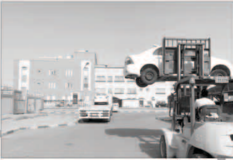
رفع السيارات الخالفة

الفرق التفتيشية رصدت 415 جمعية تعاونية وأسواقا مركزية ومحال تجارية وبسطات للخضراوات