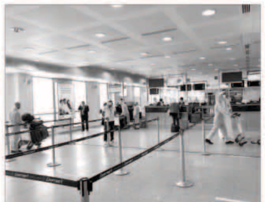
إجراءات مشددة في المطار