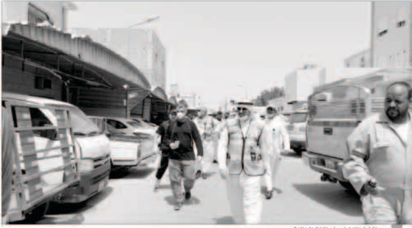
جولة فرق التفتيش على الشوارع الخالفة