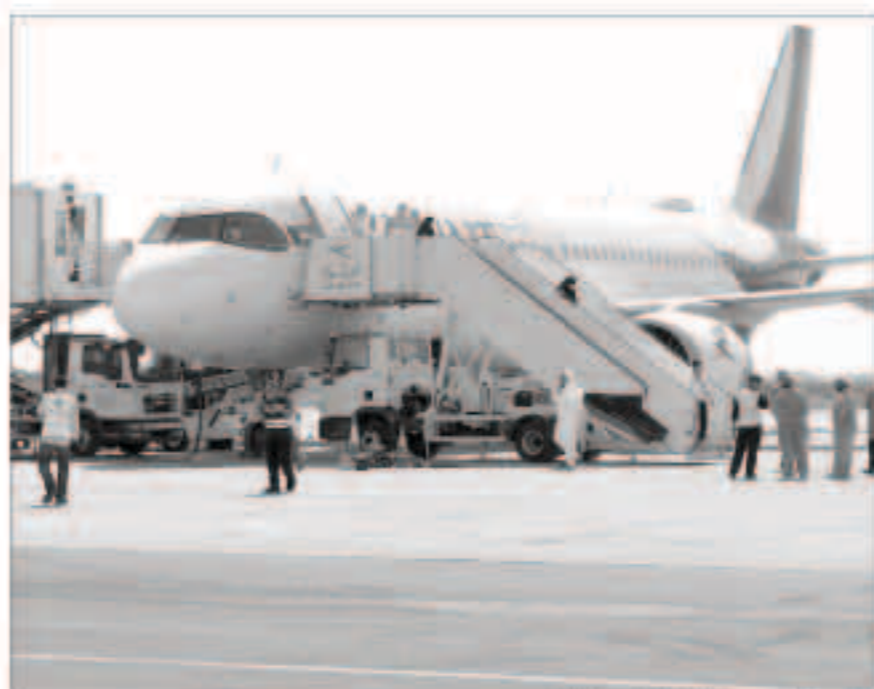
الجهود لتتضافر لإعادة العائدين