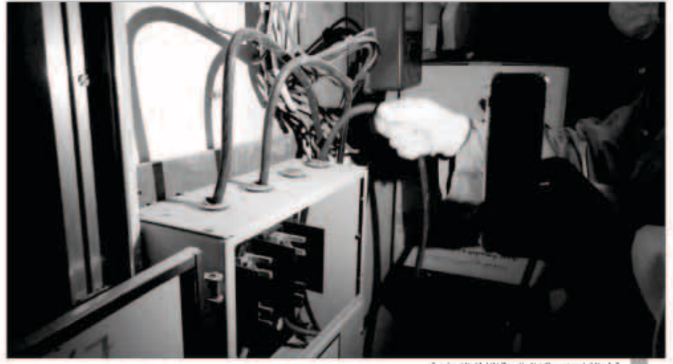
قطع التيار عن مساكن العزاب في المناطق النموذجية