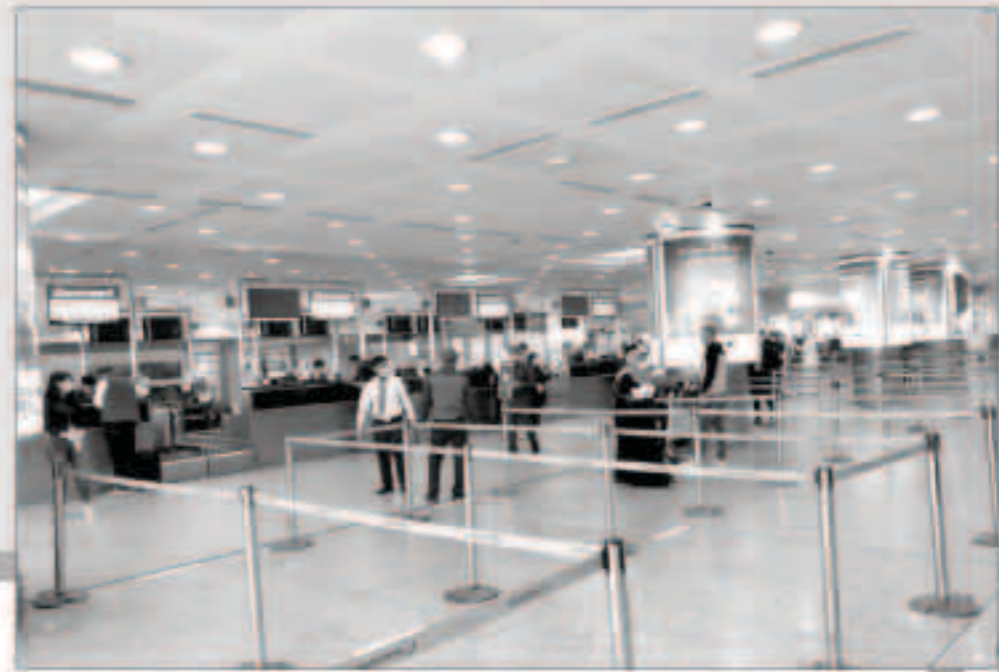
مطار الكويت بدأ استقبال القادمين من المواطنين